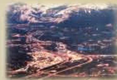
Les résidents de Jasper cohabitent dans la vallée avec les animaux sauvages du parc national Jasper.

Même dans nos parcs, les ours ont de plus en plus de difficulté à éviter l'être humain. Or, ces aires protégées forment une grande partie de ce qui subsiste de leur habitat en Amérique du Nord.