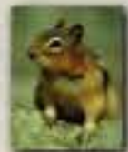
Spermophile à mante dorée

La neige fond peu à peu, et les plantes se mettent à pousser. Les ours errent sur un vaste territoire pour trouver des enclaves de végétation.