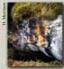
Tanière d'ours noir

Les femelles de l'ours noir et du grizzli sont toutes deux capables d'« implantation différée », c'est-à-dire que l'œuf fécondé ne s'attache à la paroi de l'utérus que si la femelle a suffisamment de réserves de graisse pour allaiter ses petits. Minuscules et aveugles, les oursons (il y en a habituellement deux) naissent dans le confort d'une tanière sûre, où ils se nourrissent du lait riche de la maman qui dort.