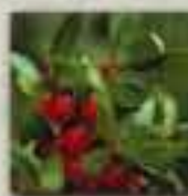
Shépherdie du Canada

Ici, dans les Rocheuses, les oursons grizzlis peuvent demeurer avec leur mère pendant cinq ans, période pendant laquelle ils apprennent à survivre en montagne. Les femelles défendent farouchement leur progéniture contre les mâles dominants et les autres menaces. Les femelles de l'ours noir enseignent à leurs petits à grimper aux arbres pour se protéger des mâles adultes et des grizzlis.