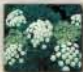
Zizia à feuilles cordiformes

Les pentes avalanches conservent toute leur importance pour le grizzli. Elles lui procurent un riche éventail de plantes dont il peut se nourrir, tout en lui offrant un abri sûr, à la lisière de la forêt. L'ours noir, qui préfère la forêt, opte plutôt pour le fond des vallées, où il peut trouver de la nourriture et, par la même occasion, se protéger des grizzlis.