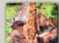
Des fourmis et d'autres insectes dans un tronc pourri