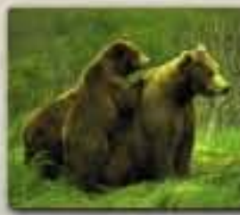
Ourse grizzli et ses oursons