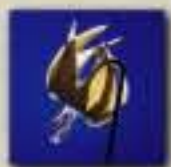
Erythrome à grandes fleurs

Les mâles se mettent à la recherche d'une compagne. Parfois, il leur faut parcourir de très grandes distances.