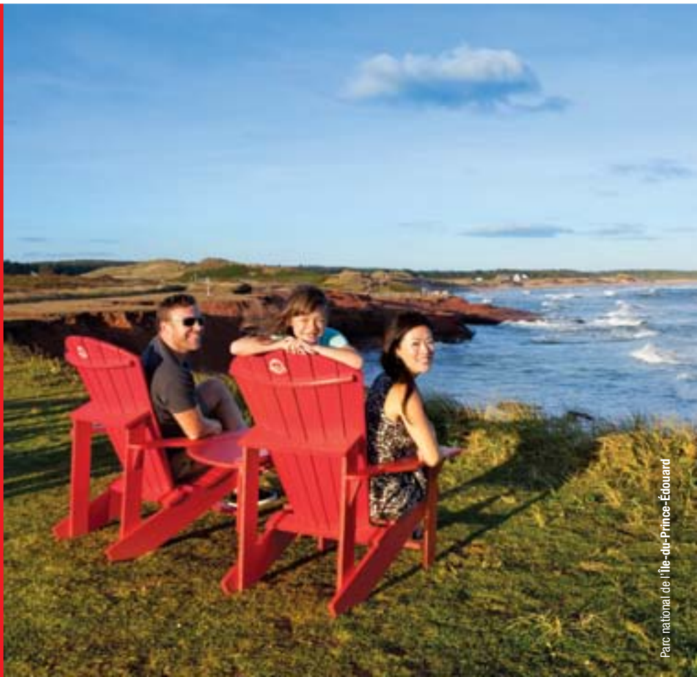
Parc national de l'Île-du-Prince-Édouard