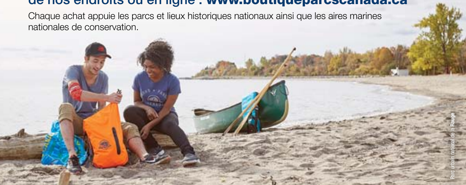
Parc urbain national de la Rouge

Chaque achat appuie les parcs et lieux historiques nationaux ainsi que les aires marines nationales de conservation.