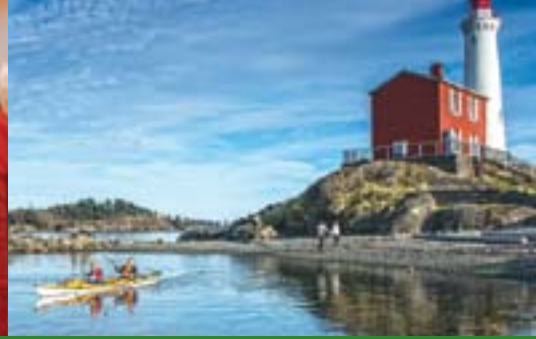
Fort Rodd Hill et du Phare-de-Fisgard