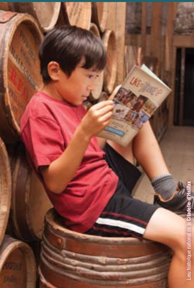
Lieu historique national de la Citadelle d'Halifax