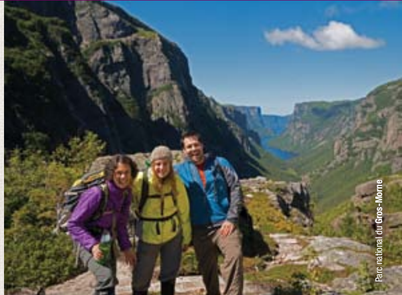
Parc national du Gros-Morne