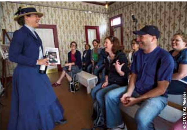
Lieux historiques nationaux du Klondike