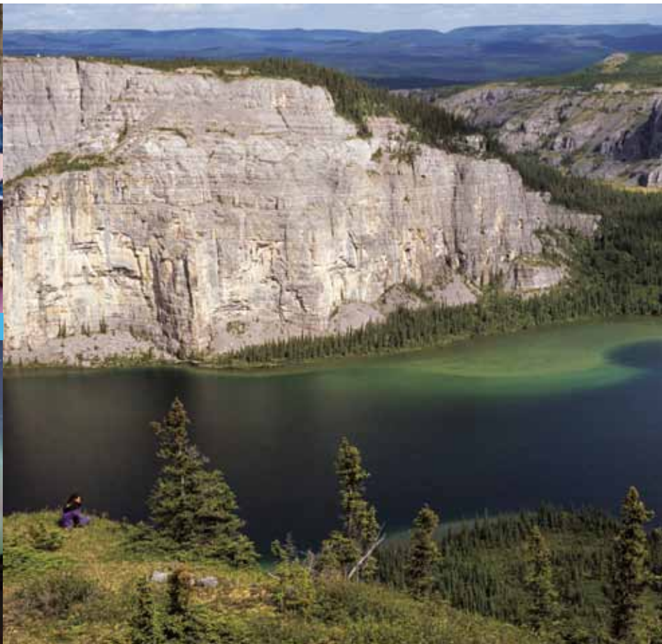
Réserve de parc national Nahanni