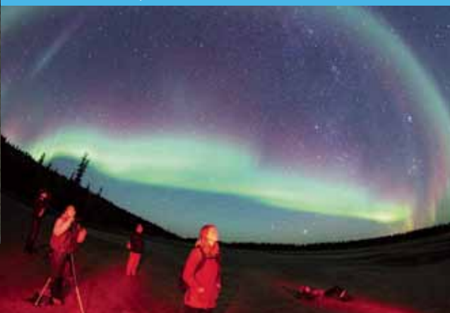
Parc national Wood Buffalo