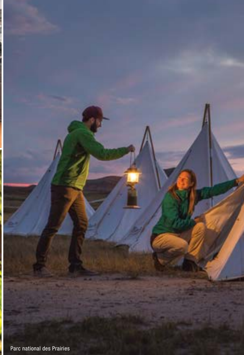
Parc national des Prairies