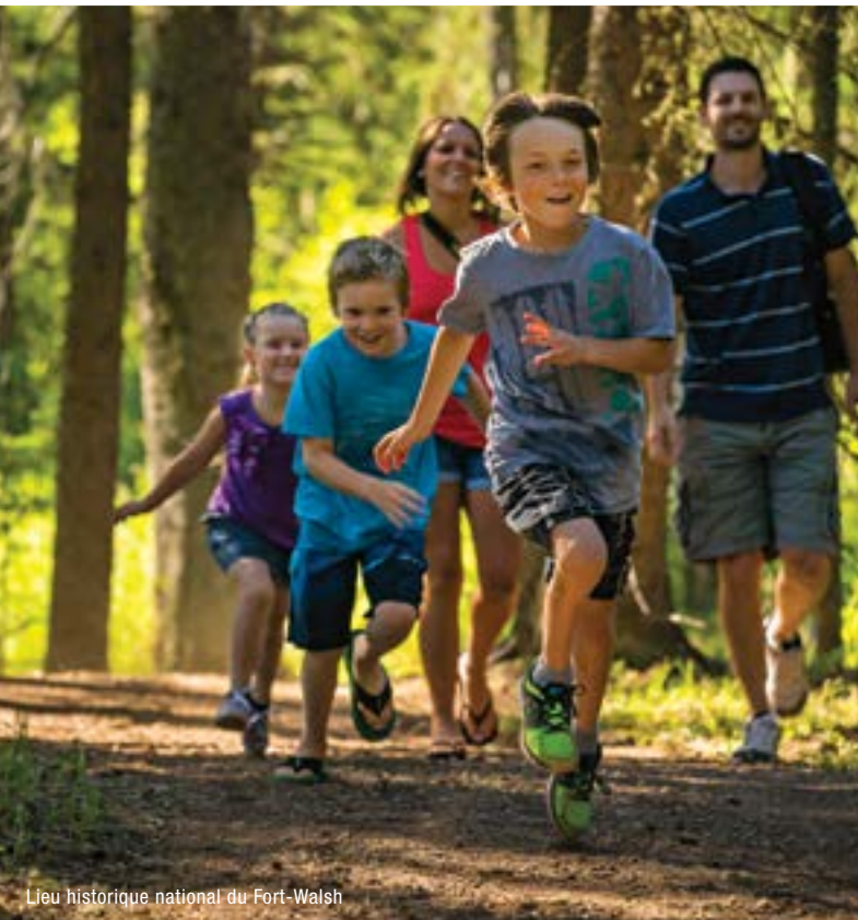
Lieu historique national du Fort-Walsh