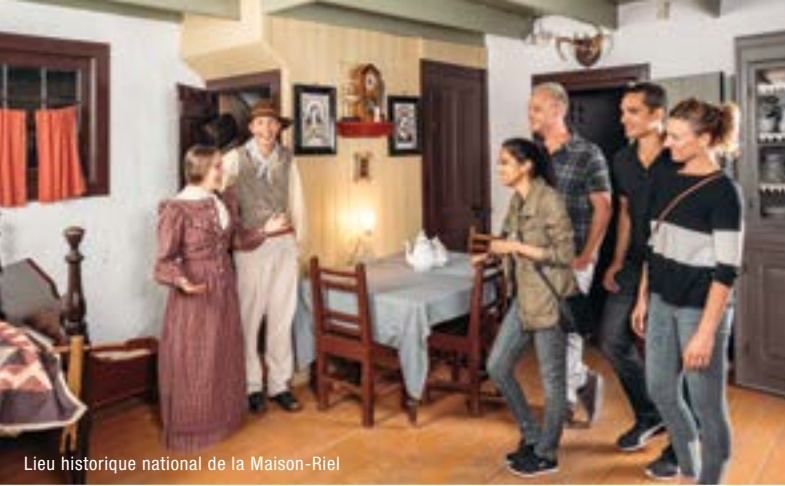
Lieu historique national de la Maison-Riel