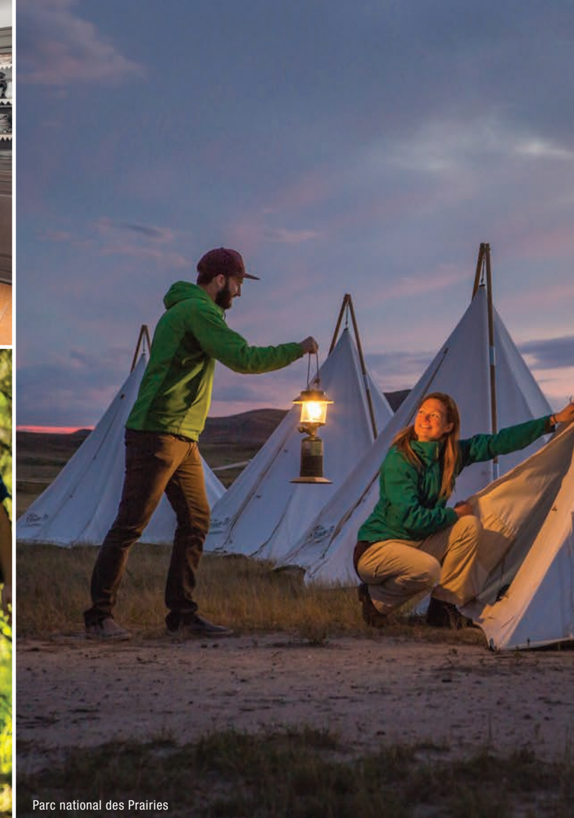
Parc national des Prairies