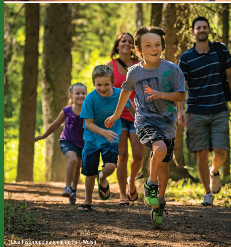
Lieu historique national du Fort-Walsh