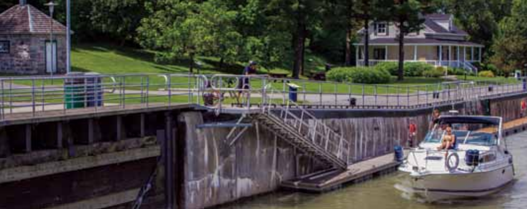
Lieu historique national du Canal-de-Saint-Ours