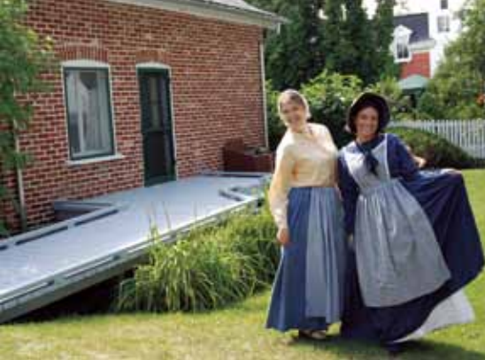
Lieu historique national de Sir-Wilfrid Laurier