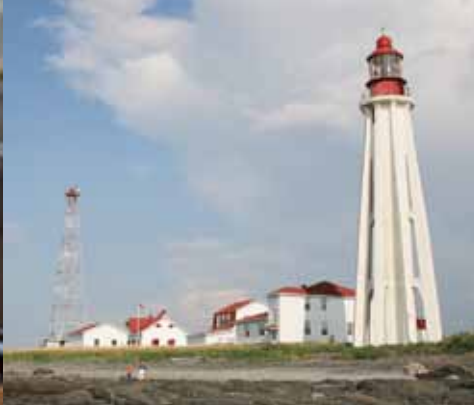
Lieu historique national du Phare-de-Pointe-au-Père