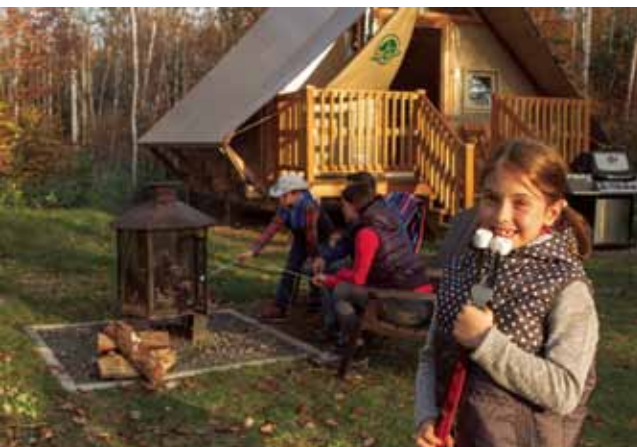
Parc national de la Mauricie