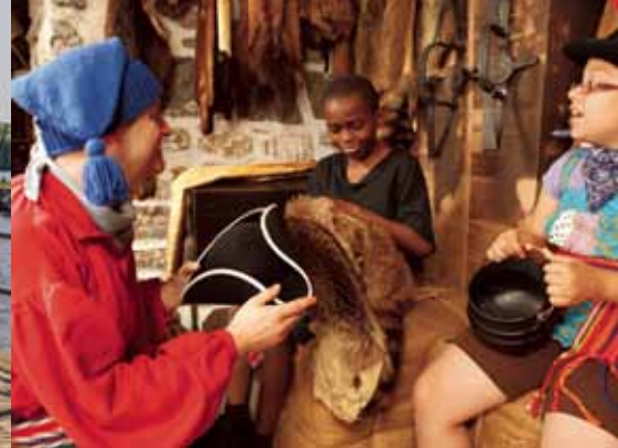
Lieu historique national du Commerce-de-la-Fourrure-à-Lachine