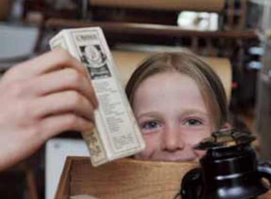
Lieu historique national Louis-S.-St-Laurent