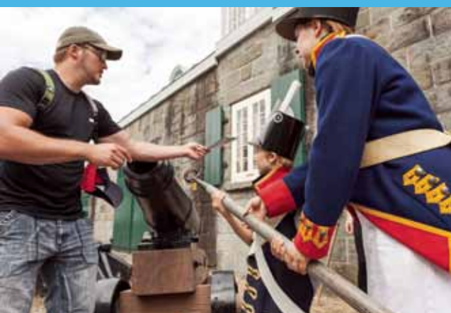
Lieu historique national des Fortifications-de-Québec