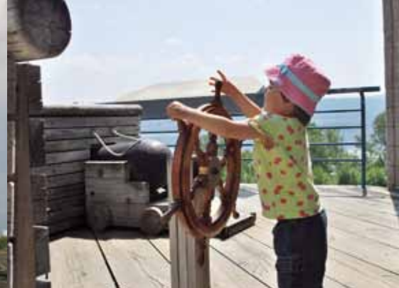
Lieu historique national de la Bataille-de-la-Restigouche