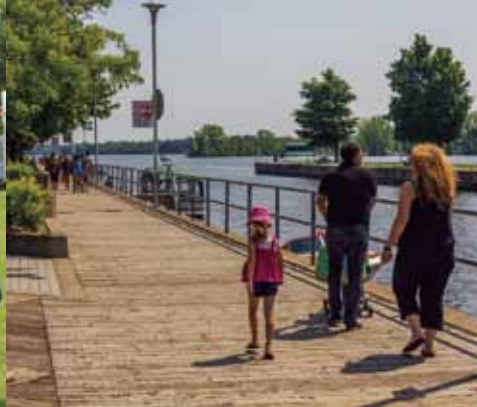
Lieu historique national du Canal-de-Sainte-Anne-de-Bellevue