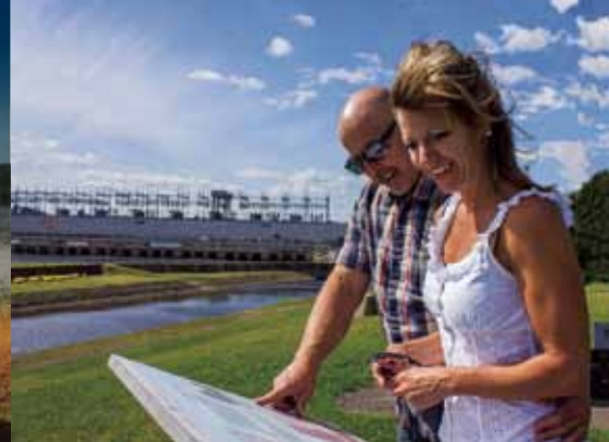
Lieu historique national du Canal-de-Carillon