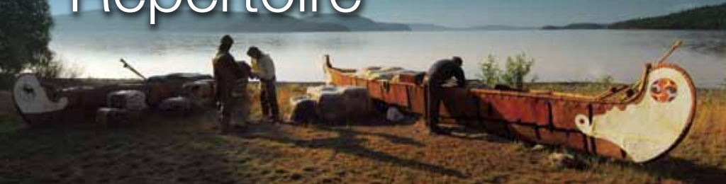
Lieu historique national du Fort-Témiscamingue