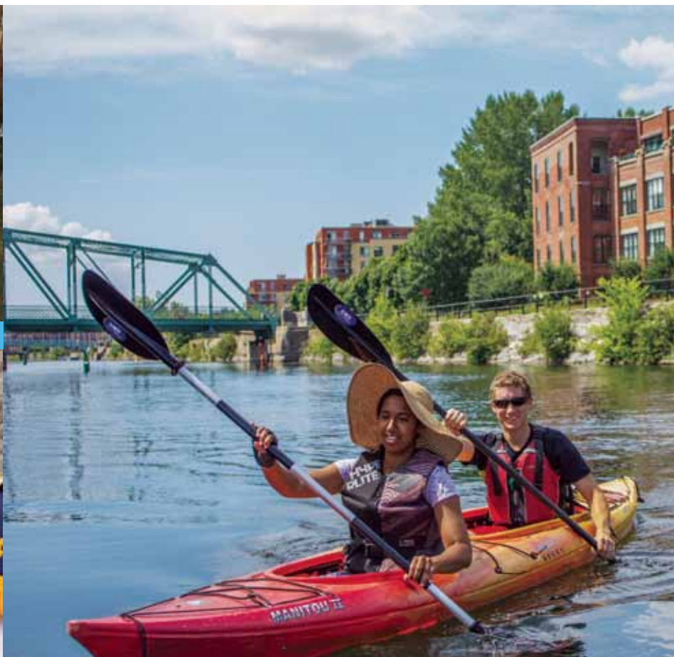
Lieu historique national du Canal-de-Lachine