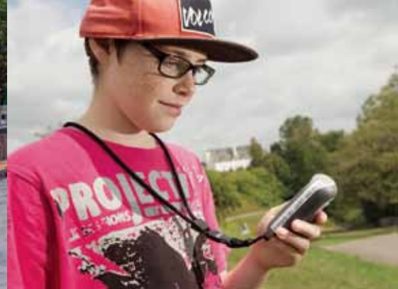
Lieu historique national des Forges-du-Saint-Maurice