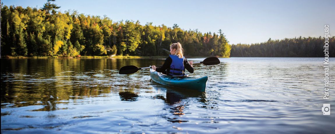
Parc national Kouchibouguac