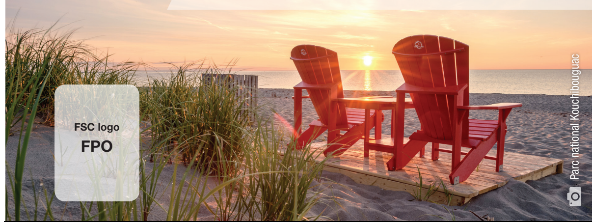
Parc national Kouchibouguac

La culture acadienne est riche et dynamique. Elle a été bâtie au fil des ans et façonnée par des événements parfois tragiques, démontrant la force et la résilience du peuple acadien. Aujourd'hui, l'Agence Parcs Canada protège, honore et partage ce riche chapitre de l'histoire canadienne grâce à plusieurs endroits protégés dans les provinces maritimes.