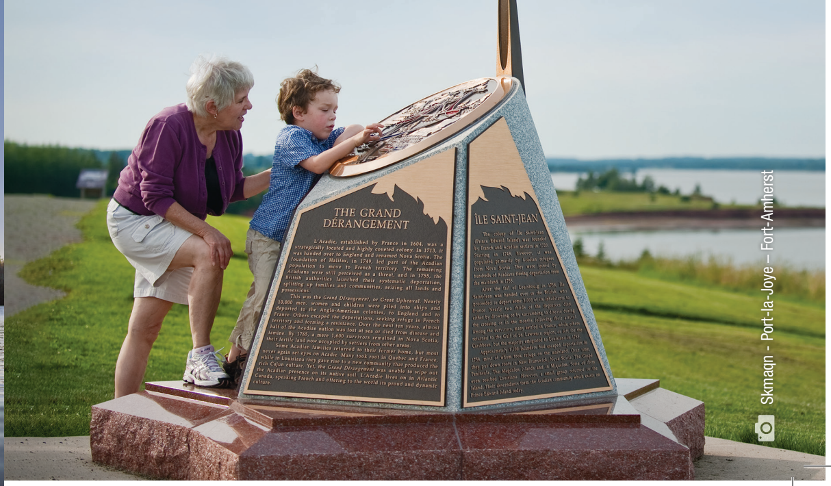
Skmaq – Port-la-Joye – Fort-Amherst