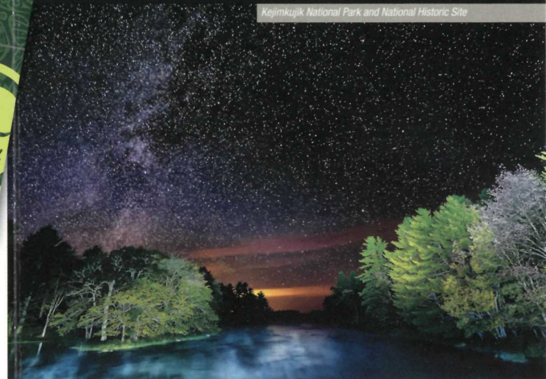
Kejimikujik National Park and National Historic Site