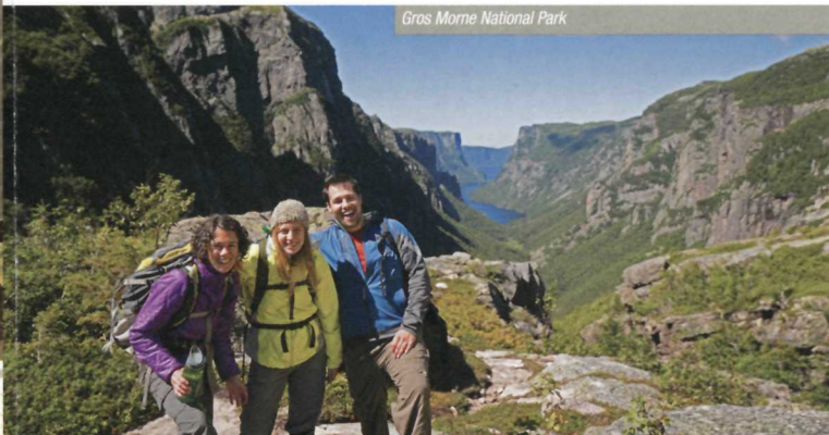
Gros Morne National Park