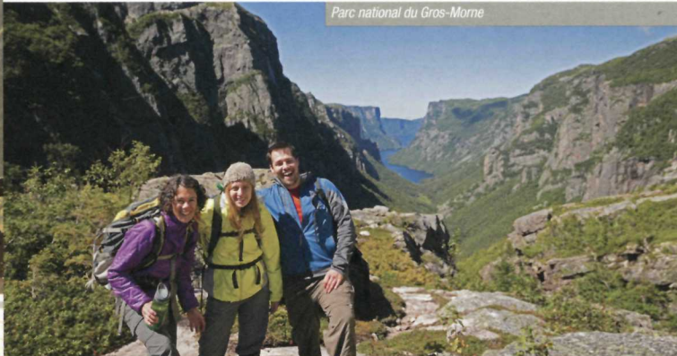
Parc national du Gros-Morne