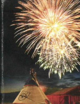
Rocky Mountain House National Historic Site

Celebrate Canada 150 with Parks Canada! Canada's national parks, national marine conservation areas and national historic sites are the ultimate awe-inspiring experience.