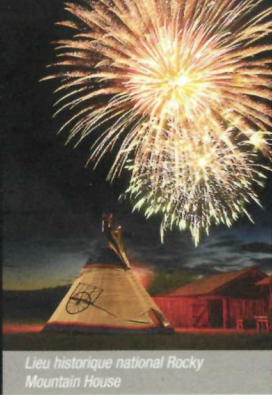
Lieu historique national Rocky Mountain House

Célébrez le 150 e du Canada avec Parcs Canada!