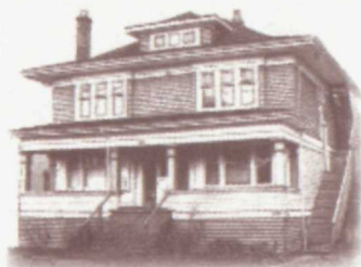
La maison cubique édouardienne (1900-1920)

Façade cubique symétrique avec toit à pente douce. Éléments typiques : petit porche d'entrée – avant-toits avec corbeaux décoratifs – oriel à plusieurs faces souvent sur deux étages – fenêtre à guillotine hautes et étroites – pas d'assise de ceinture