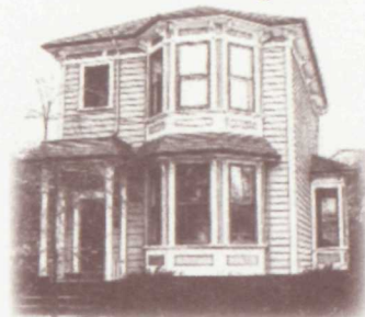
La maison de style italianisant (1860-1900)

Façade cubique symétrique avec toit à pente douce. Éléments typiques : petit porche d'entrée – avant-toits avec corbeaux décoratifs – oriel à plusieurs faces souvent sur deux étages – fenêtre à guillotine hautes et étroites – pas d'assise de ceinture