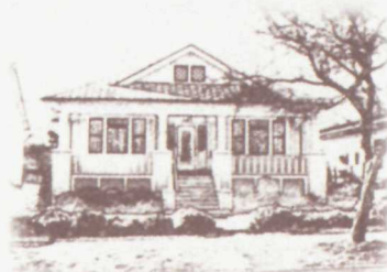
Le bungalow colonial (1905-1925)

Maison cubique de deux étages avec toit en croupe à pente douce Éléments typiques : quatre pièces à chaque étage – larges avant-toits – porche avant proéminent – éléments horizontaux, comme assise de ceinture et bardage contrasté sur différents niveaux