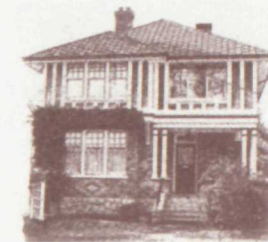
Arts & Crafts britannique (1905-1930)

Style de construction typique de Victoria Un étage et demi, avec toit à pente raide, assise de ceinture, rez-de-chaussée symétrique, étage supérieur symétrique. Éléments typiques : pignon à l'avant – lucarnes sur les côtés – porche d'angle en retrait équilibré par une fenêtre en baie – bardage contrasté