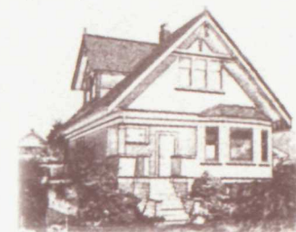
La maison vernaculaire édouardienne Arts & Crafts (1904-1914)

Façade asymétrique avec toit à pente raide Éléments typiques : divers traitements de surface – tourelles – faîteaux – corniches et bordures de pignon décorées – porche avant proéminent avec motifs de fuseaux – fenêtres en baie coupées à plusieurs faces – fenêtres à guillotine