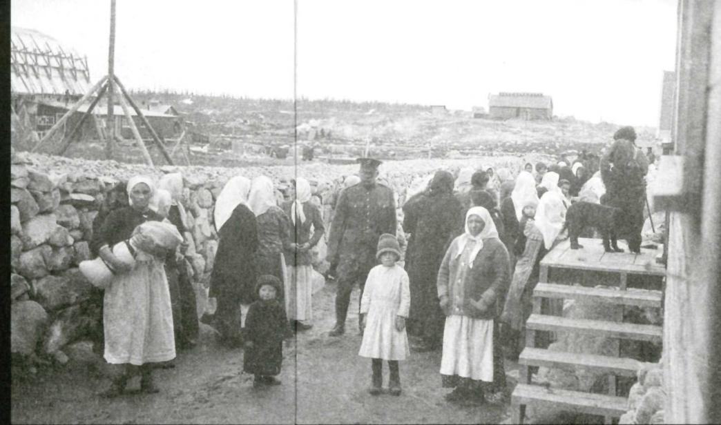
Women and children were not subject to internment, yet some had little choice and accompanied their male relatives into the camps