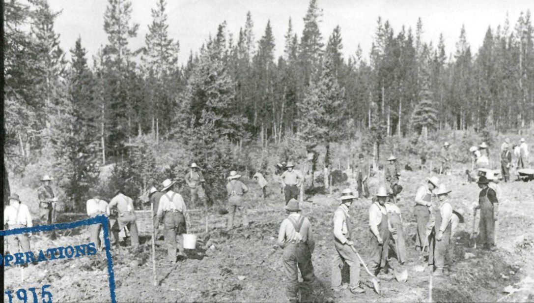
Internees clear the way for the road to Lake Louise, 1915