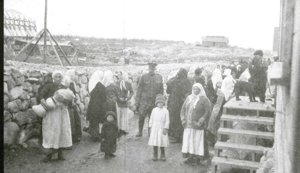
Les femmes et les enfants n'étaient pas assujettis à l'internement. Malgré tout, certains n'avaient d'autre choix que d'accompagner le soutien de famille jusqu'au camp