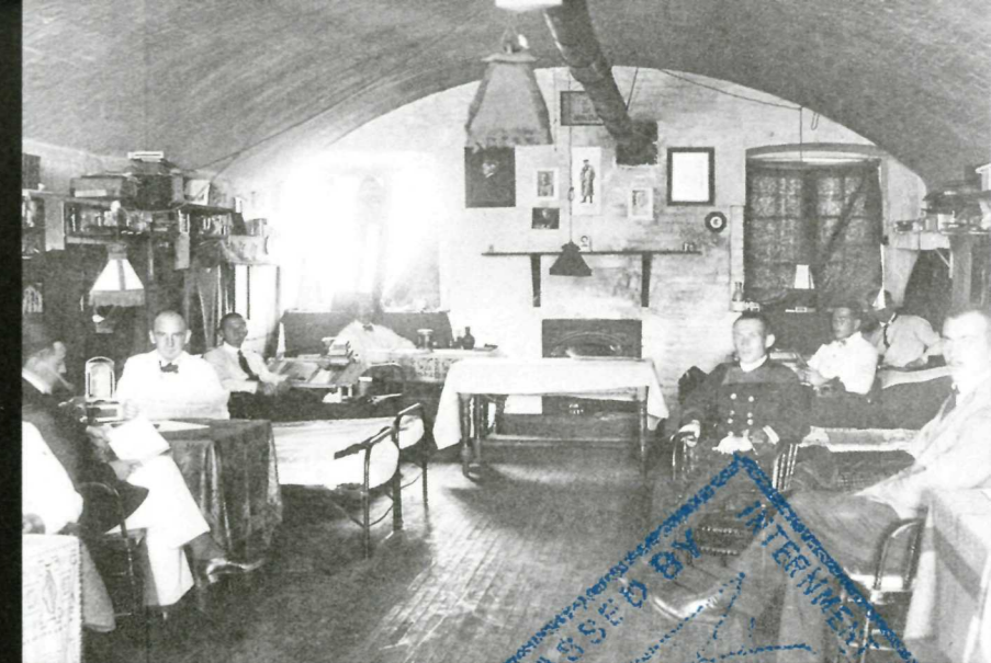
Des détenus de première classe à la citadelle d'Halifax

PASSED BY INTERVIEW CENSOR MAY 28 1917 VERNON, B.C.