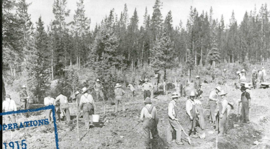
Des détenus préparant le terrain en vue de la construction d'une route jusqu'à Lake Louise, 1915