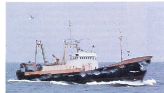
Un chalutier moderne à pêche arrière A modern stern trawler

moyenne plus de 30 mètres et portaient un équipage de 18 à 24 hommes.