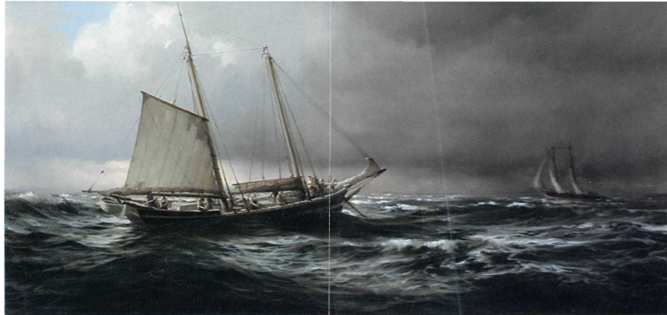
Une goélette de l'époque coloniale, vers 1830 A colonial schooner, c1830

Les pêcheurs des Colonies utilisaient un nouveau type de bateau: la goélette. Ses dimensions – environ 20 mètres – et son grément simple en rendaient la manoeuvre plus facile que celle des bateaux de la pêche salée en vert. Comme leurs ports d'attache se trouvaient beaucoup plus près des bancs, les goélettes pouvaient faire trois ou quatre voyages dans une même saison de pêche. Les équipages comptaient entre sept et douze hommes qui pêchaient à la ligne à main, comme sur les voiliers grésés en carré.