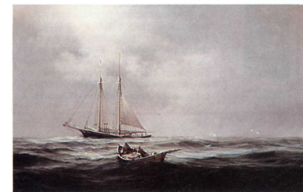
A dory and schooner, c1900 Goélette et doris, vers 1900

about the golden age of the bank fishery under sail in the 1880s. By this time, schooners averaged more than 30 metres long and carried crews of 18 to 24 men.