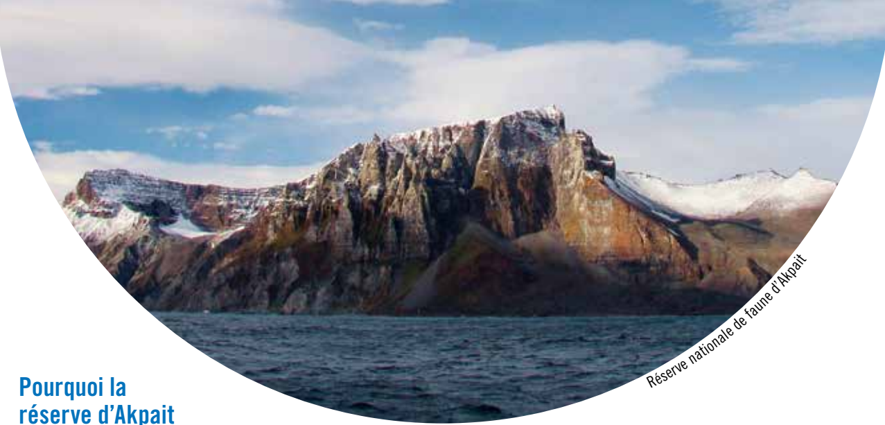
Réserve nationale de faune d'Akpait