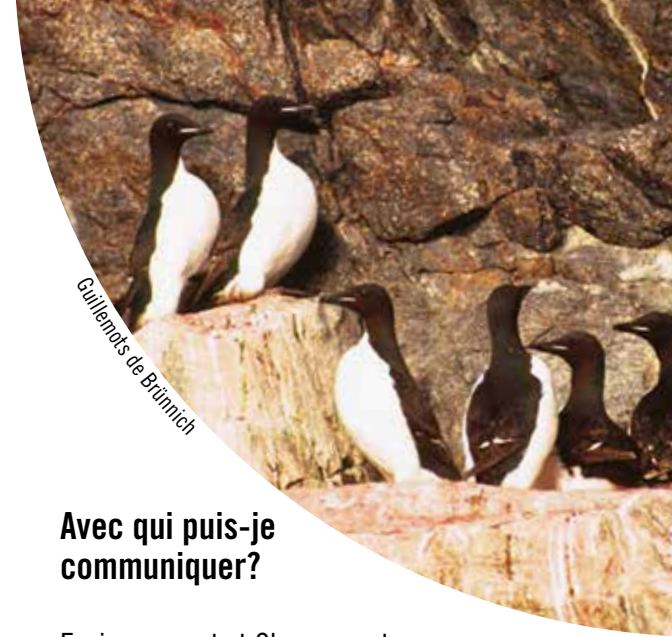
Guillemots de Brünnich

Dans le territoire du Nunavut, les bénéficiaires du Nunavut, en vertu de l'Accord sur les revendications territoriales du Nunavut, peuvent récolter les espèces fauniques pour leurs besoins économiques, sociaux et culturels. L'accès à la RNF d'Akpait est limité, excepté pour les bénéficiaires du Nunavut. Tous les non-bénéficiaires doivent obtenir un permis pour accéder à la RNF ou y effectuer tout type d'activité. Pour en savoir plus sur l'accès à la RNF d'Akpait et l'obtention de permis, veuillez communiquer avec le bureau régional d'Environnement et Changement climatique Canada.