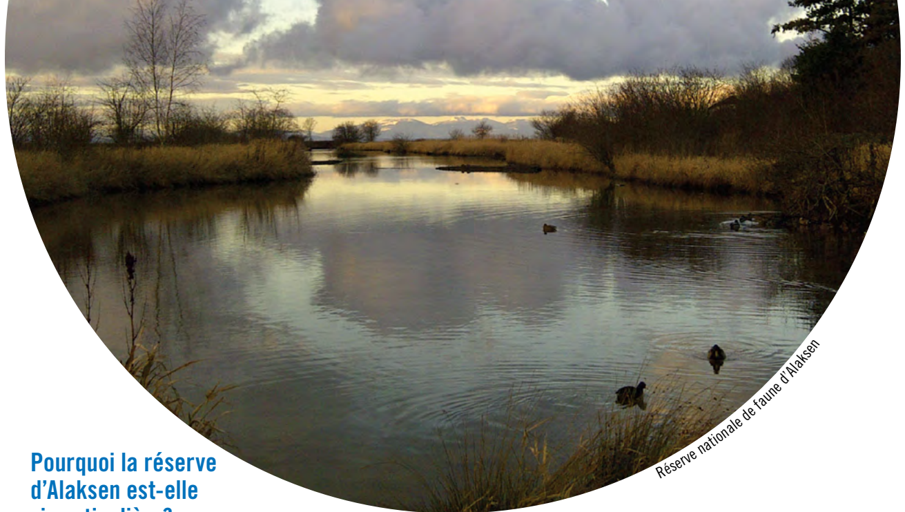
Réserve nationale de faune d'Alaksen