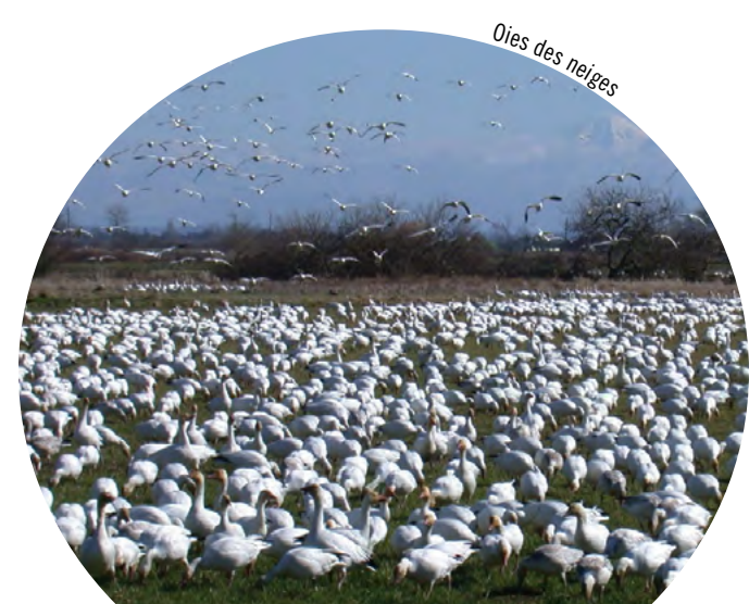
Oies des neiges

La portion de la RNF où se situe le ROM de George C. Reifel, lequel est géré par la British Columbia Waterfowl Society en vertu d'une entente avec Environnement Canada, est ouverte au public, et l'observation de la faune y est autorisée. Elle attire chaque année des dizaines de milliers de visiteurs. La chasse est strictement interdite dans la RNF, et les activités permises se limitent à l'observation des oiseaux et aux activités organisées par le ROM de George C. Reifel.