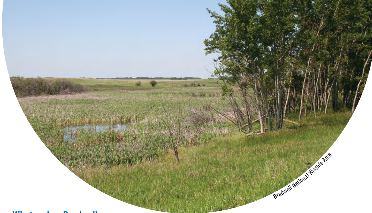
Bradwell National Wildlife Area