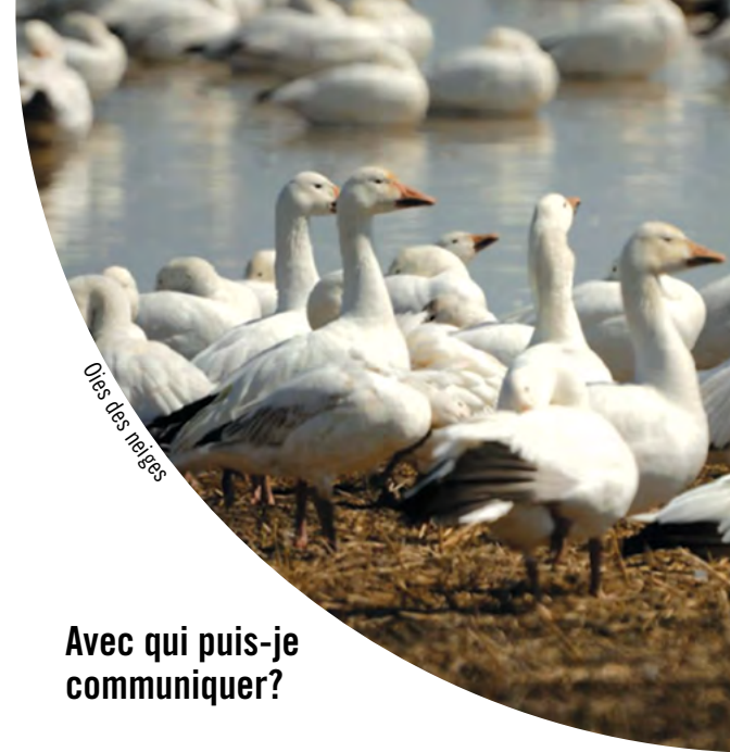
Oies des neiges