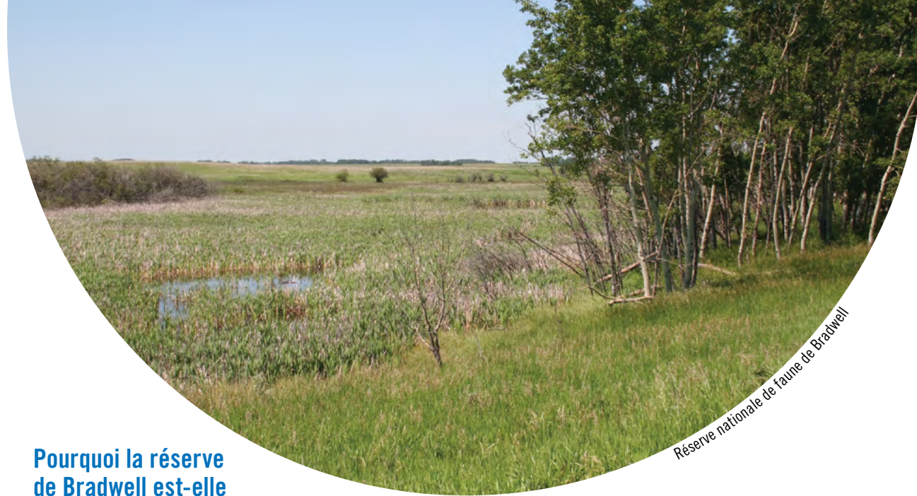
Réserve nationale de faune de Bradwell