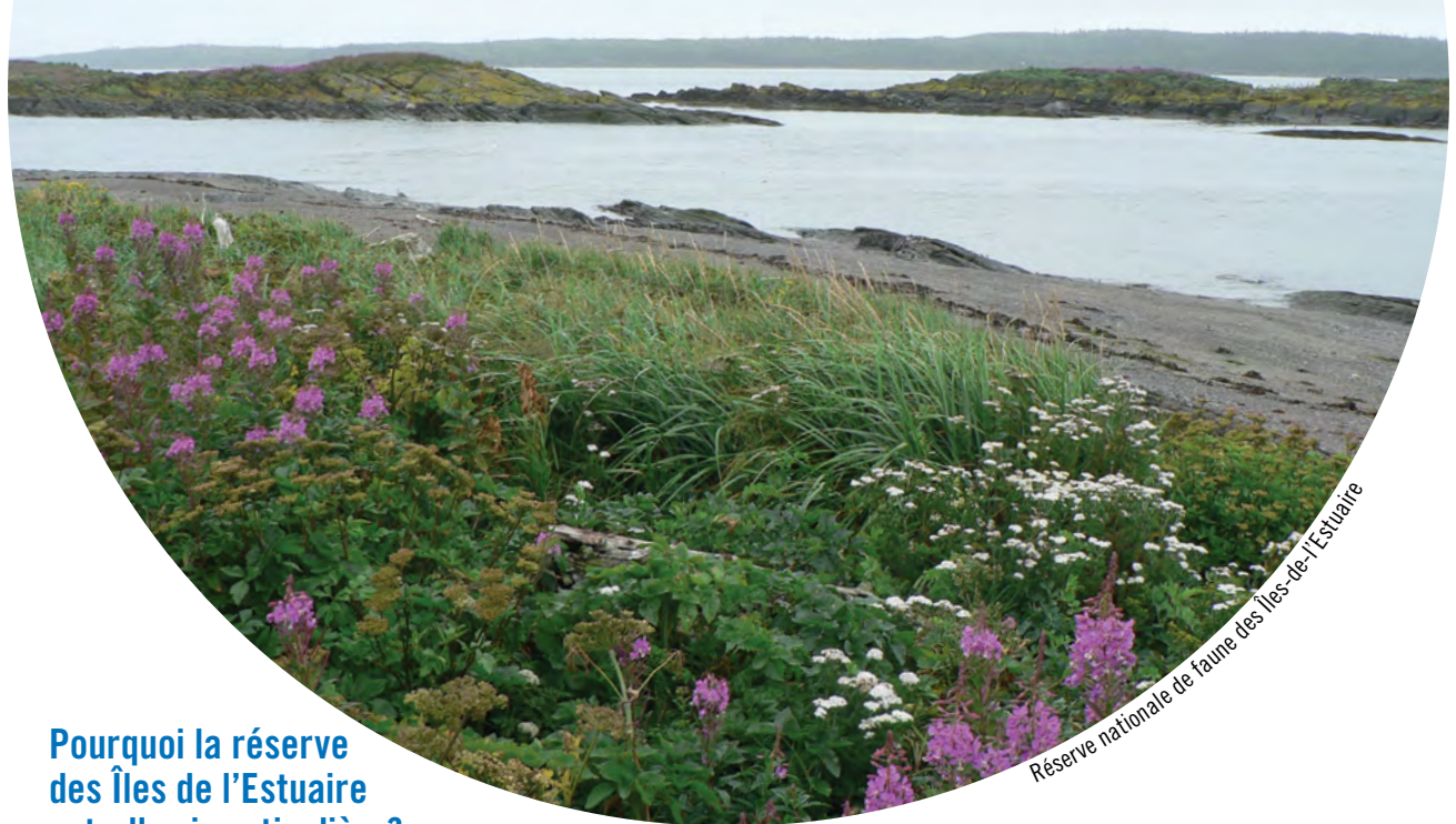
Réserve nationale de faune des Îles-de-l'Estuaire