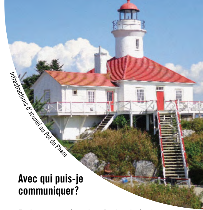
Infrastructures d'accueil au Pot du Phare