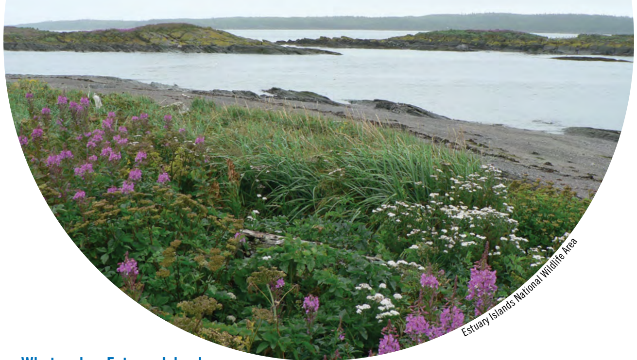
Estuary Islands National Wildlife Area