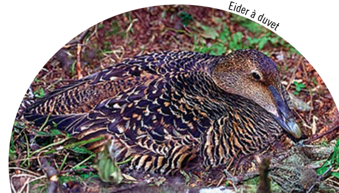
Eider à duvet

En raison de la fragilité des écosystèmes de la réserve, l'accès public est autorisé seulement dans une partie de l'île Le Pot du Phare à des fins de sensibilisation. Les visiteurs sont admis uniquement après la période de nidification des oiseaux marins, soit de la mi-juillet à la mi-octobre, et à condition d'utiliser le service de transport offert par Duvetnor, l'organisme autorisé par Environnement Canada. La randonnée pédestre, l'observation de la faune et de la flore ainsi que la photographie sont autorisées à des endroits désignés.