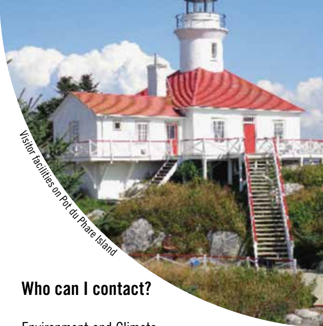
Visitor facilities on Pot du Phare Island