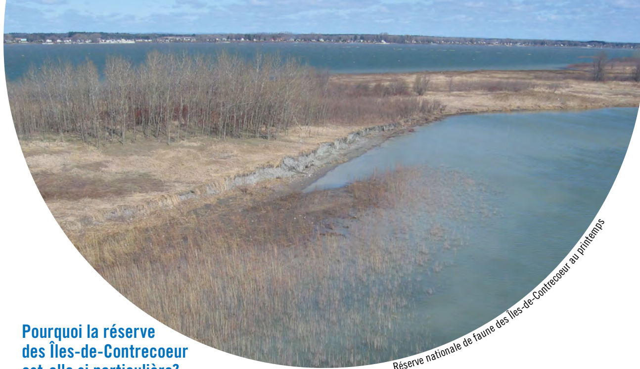
Réserve nationale de faune des Îles-de-Contrecoeur au printemps