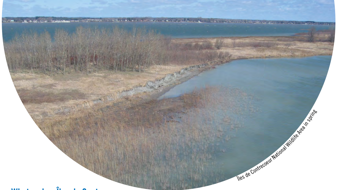
Îles de Contrecoeur National Wildlife Area in Spring