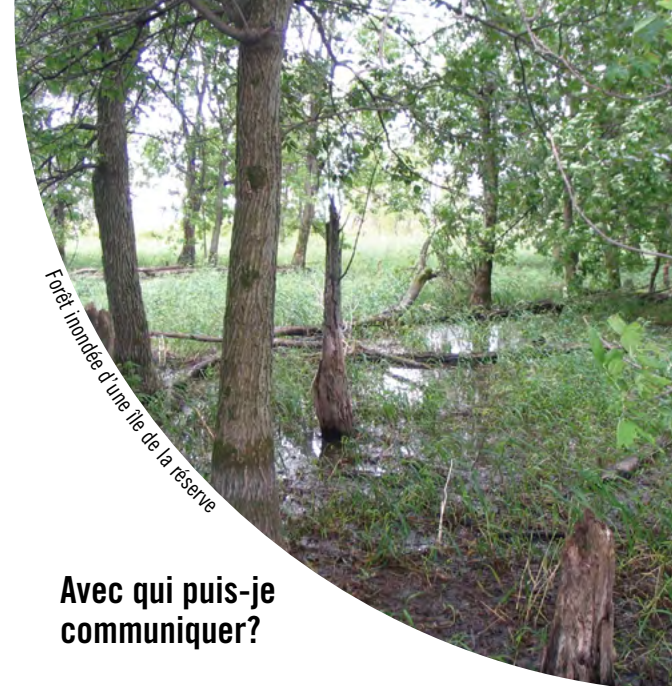
Forêt inondée d'une île de la réserve