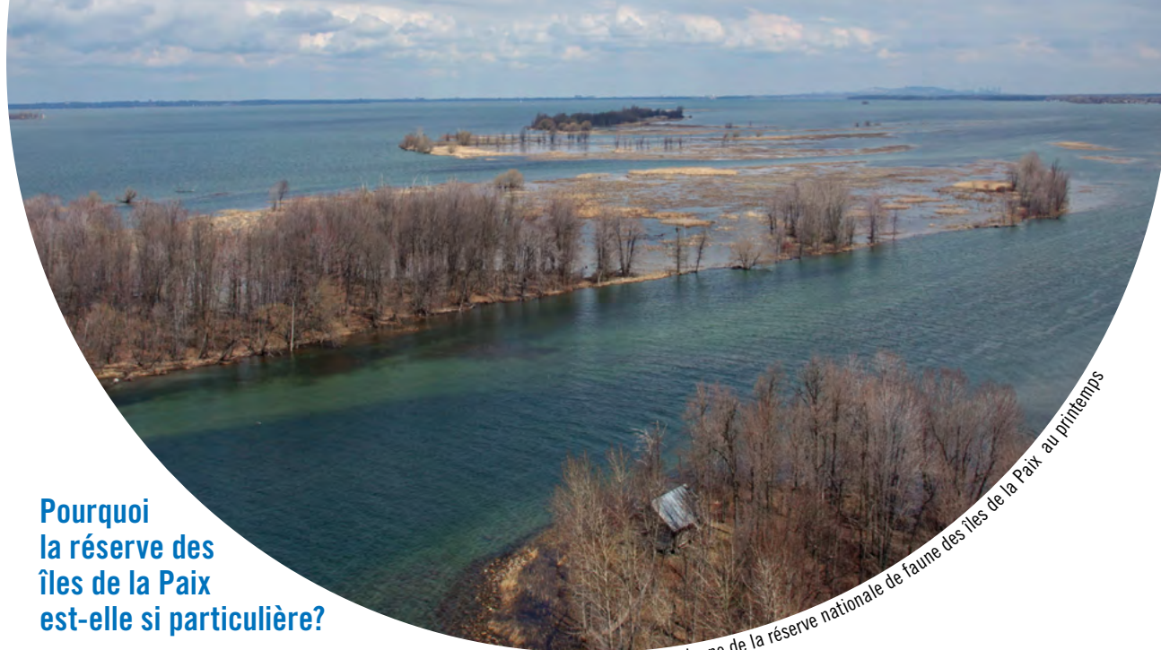
Vue aérienne de la réserve nationale de faune des îles de la Paix au printemps