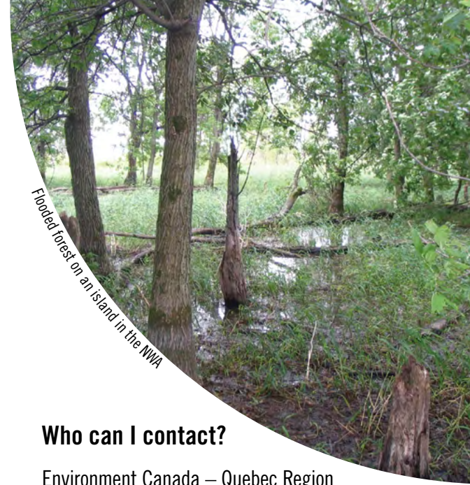
Flooded forest on an island in the NWA