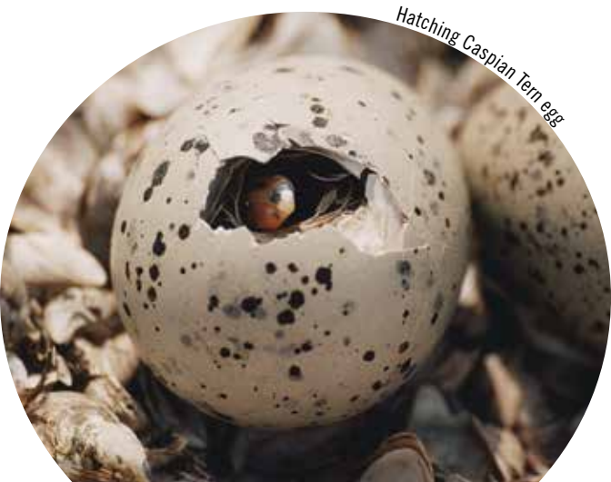
Hatching Caspian Tern egg