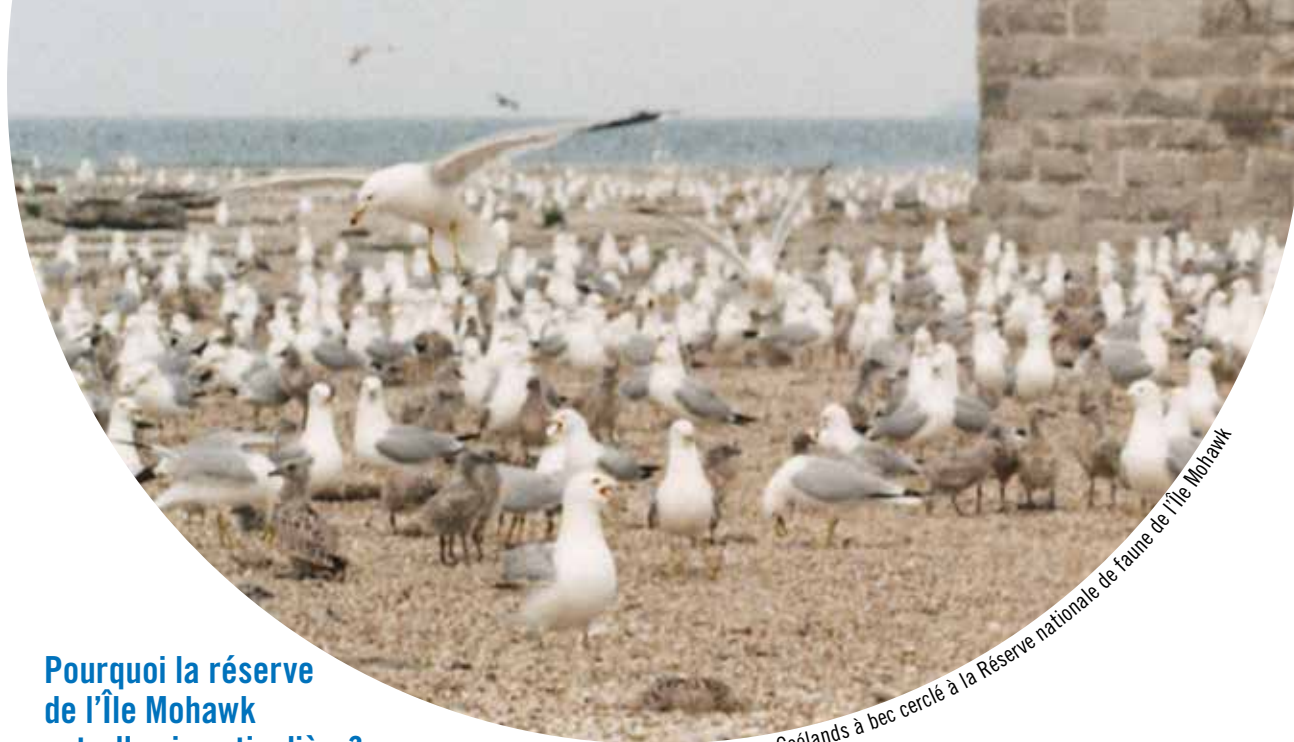
Goélands à bec cerclé à la Réserve nationale de faune de l'île Mohawk