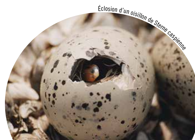
Éclosion d'un oisillon de Sterne caspienne

L'accès public à la RNF est interdit entre le 1 er avril et le 31 août pour éviter de déranger les oiseaux aquatiques coloniaux durant la saison de nidification. L'accès public à la RNF pour des activités journalières n'est permis qu'entre le 1 er septembre et le 31 mars (en dehors de la saison de nidification) pour les activités comme l'observation d'oiseaux, l'observation du phare, la pêche récréative (les pesées en plomb ne sont pas autorisées) et la baignade. Le camping de nuit, les feux de camp et la chasse sont interdits en tout temps. Il faut se procurer un permis auprès du Service canadien de la faune pour y effectuer de la recherche, des inventaires et de la surveillance.