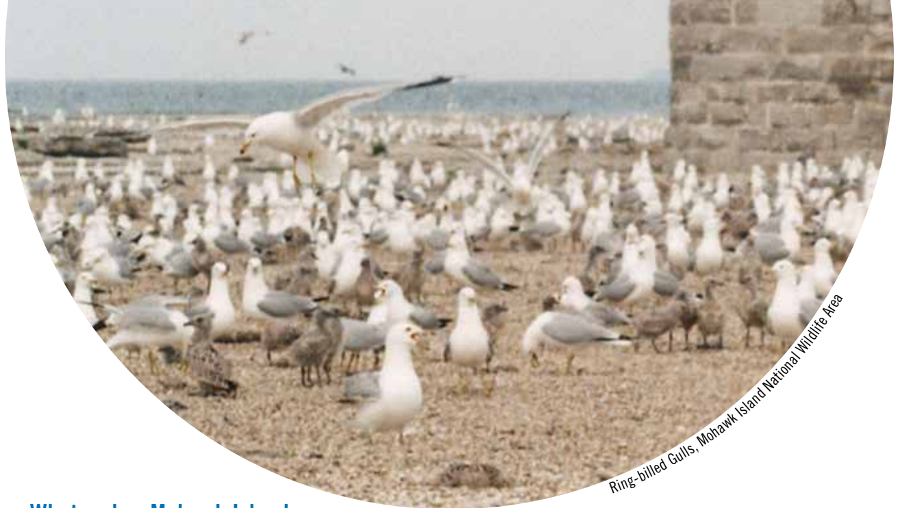
Ring-billed Gulls, Mohawk Island National Wildlife Area