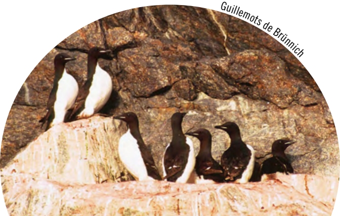
Guillemots de Brünnich