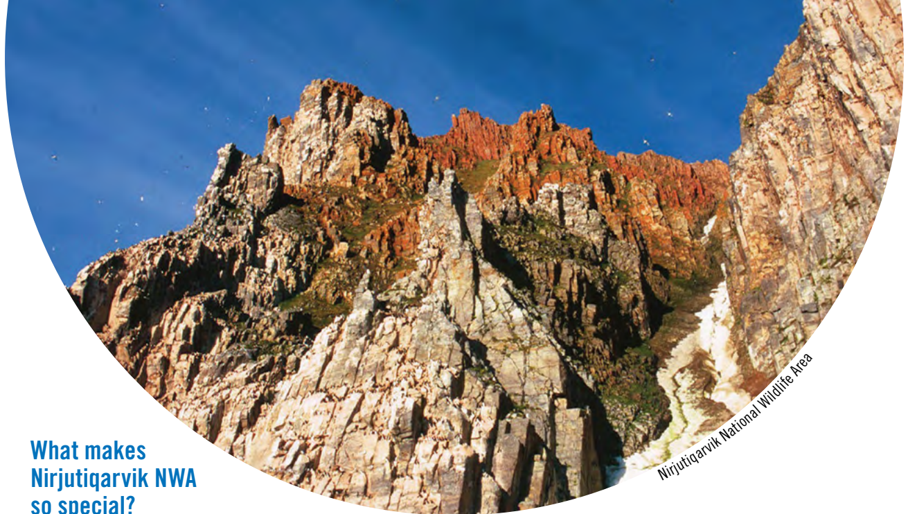
Nirjutiqarvik National Wildlife Area