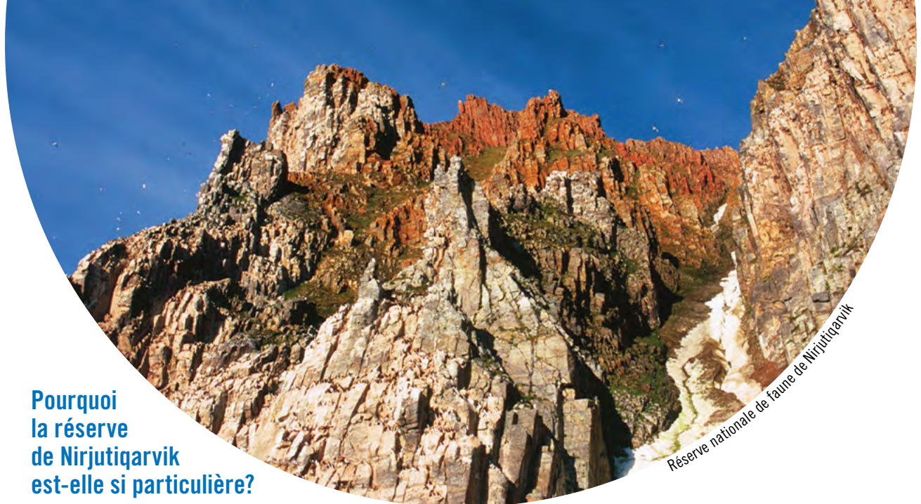
Réserve nationale de faune de Nirjutiqrvik