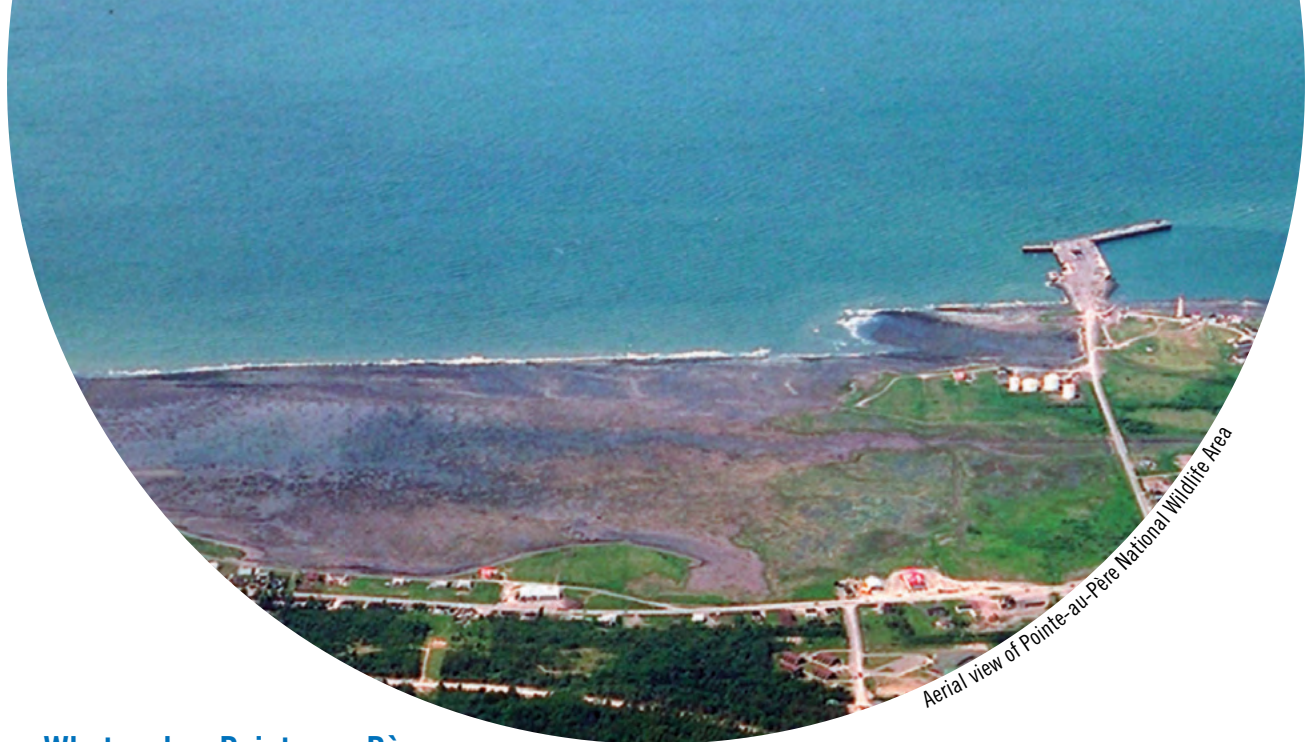
Aerial view of Pointe-au-Père National Wildlife Area