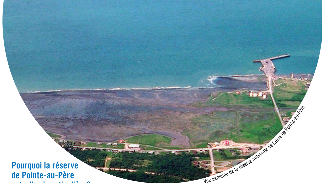
Vue aérienne de la réserve nationale de faune de Pointe-au-Père

Environnement Canada établit des RNF terrestres et marines à des fins de conservation, de recherche