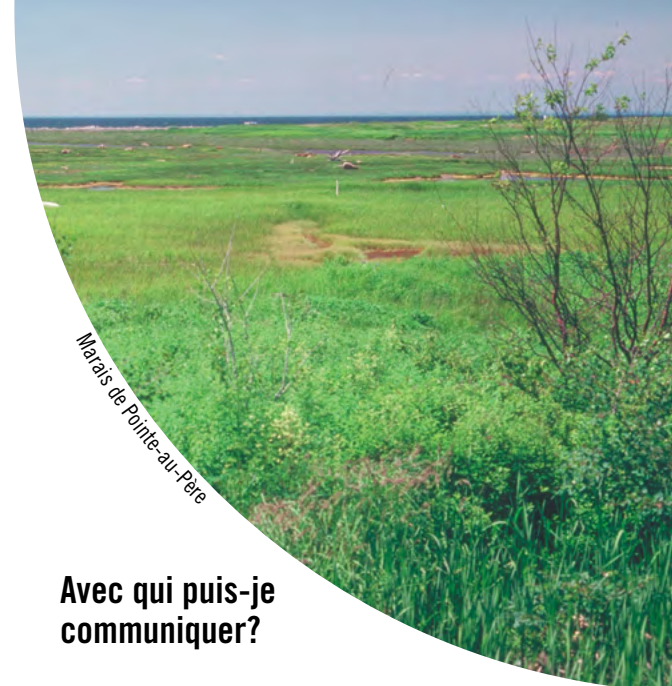
Marais de Pointe-au-Père