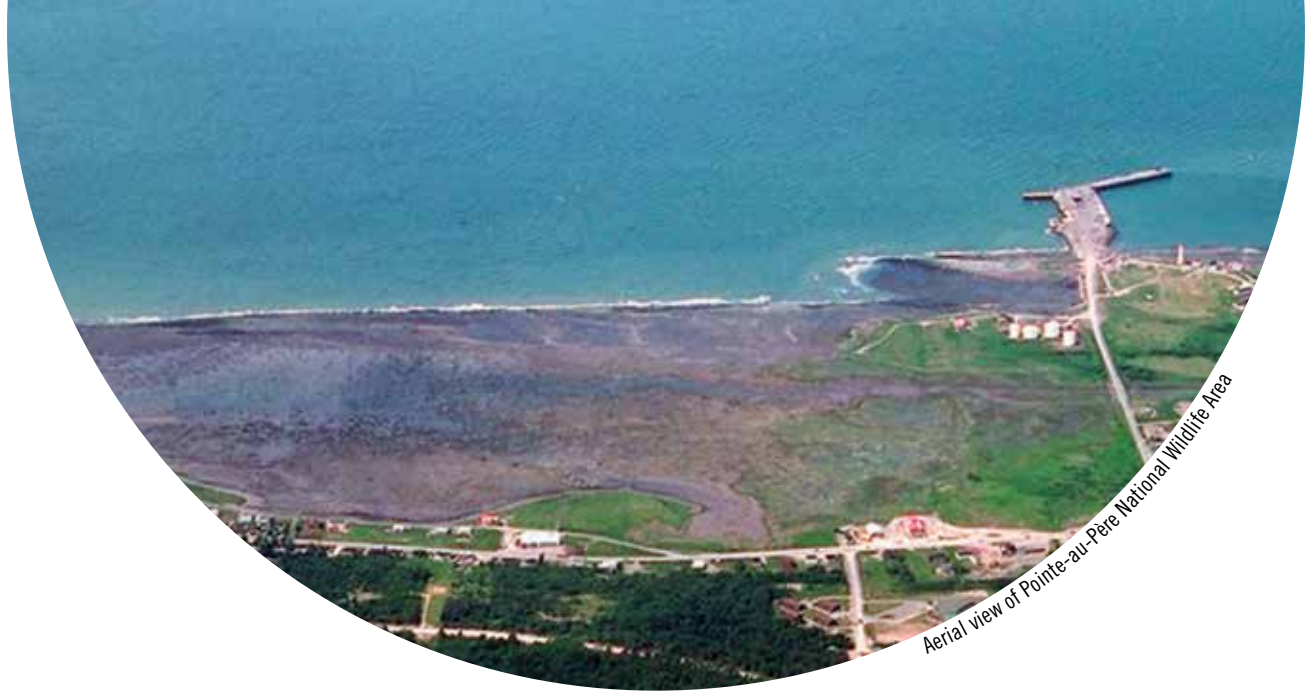
Aerial view of Pointe-au-Père National Wildlife Area