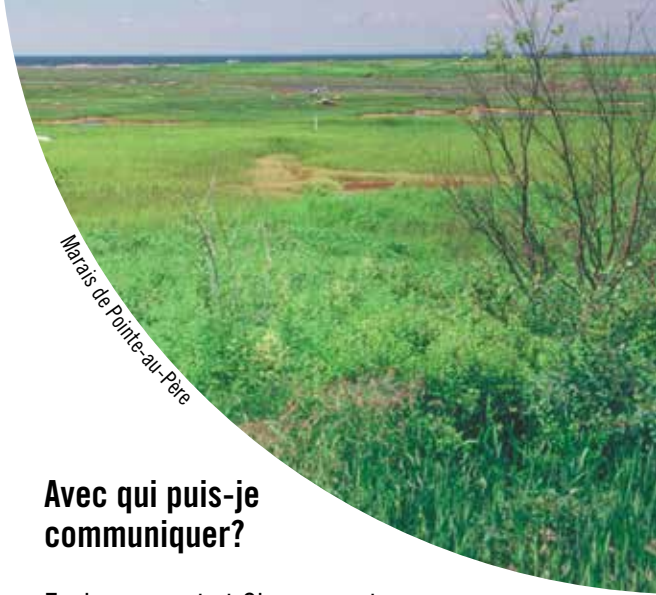
Marais de Pointe-au-Père