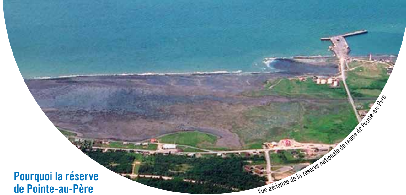
Vue aérienne de la réserve nationale de faune de Pointe-au-Père