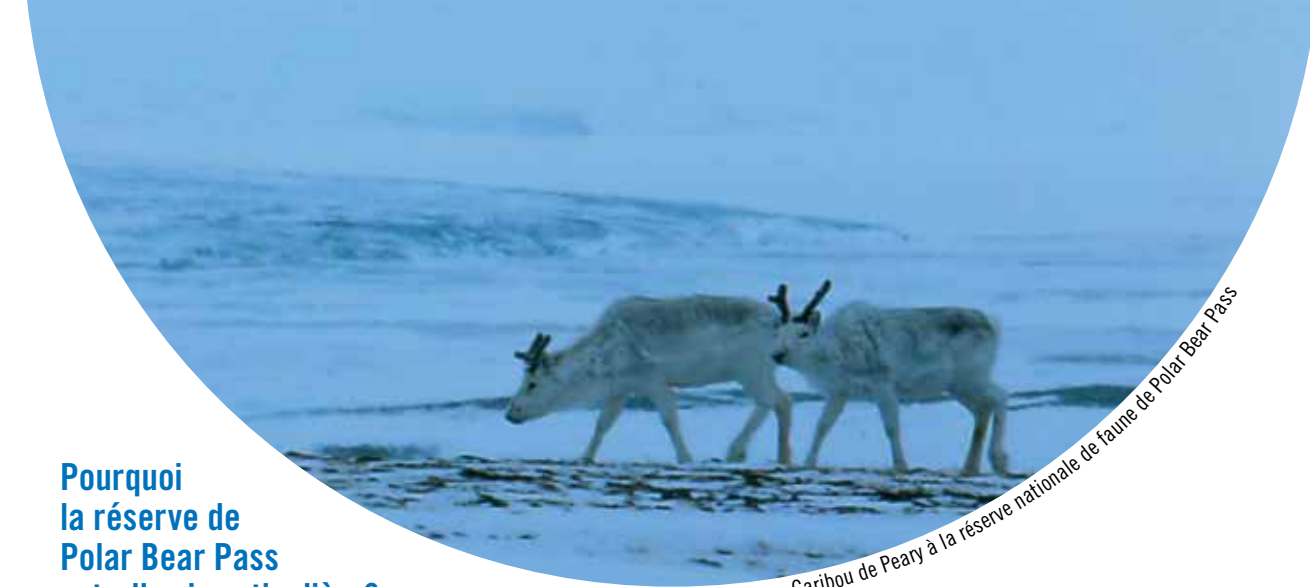
Caribou de Peary à la réserve nationale de faune de Polar Bear Pass