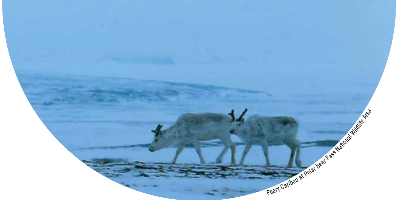
Peary Caribou at Polar Bear Pass National Wildlife Area