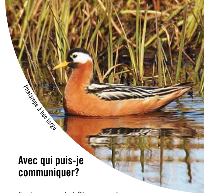
Phalarope à bec large