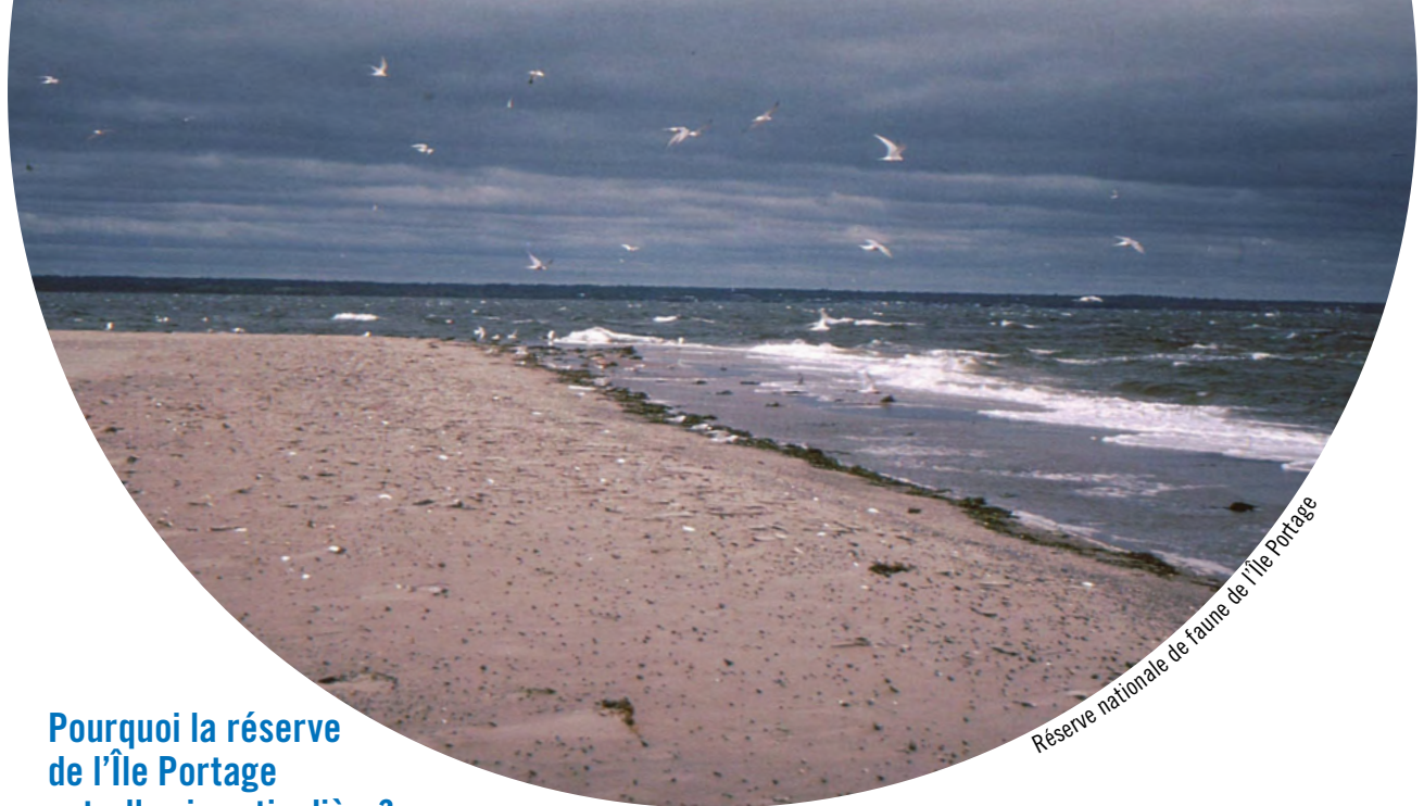
Réserve nationale de faune de l'Île Portage