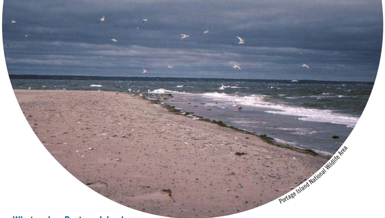
Portage Island National Wildlife Area