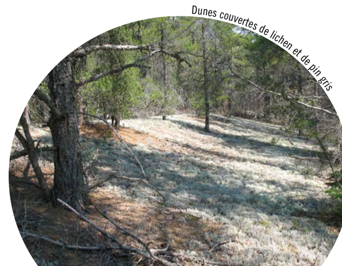
Dunes couvertes de lichen et de pin gris

L'accès à la réserve est autorisé pour des activités comme l'observation de la faune, les pique-niques ou la randonnée. Toutefois, on n'encourage pas la population à s'y rendre en raison de la fragilité de l'habitat dunaire et de la présence d'espèces en voie de disparition. Il est interdit d'y amener chiens et chats afin de protéger les aires de nidification fragiles sur les plages. La chasse et le piégeage peuvent être pratiqués, mais sont assujettis aux règlements et conditions provinciaux et fédéraux.