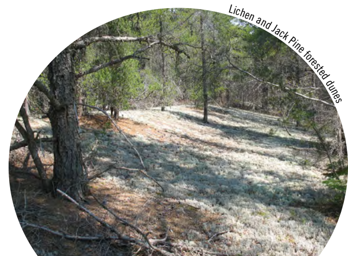
Lichen and Jack Pine forested dunes