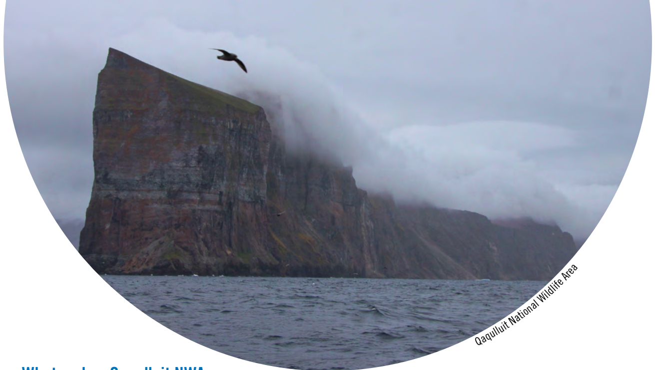
Qaqulluit National Wildlife Area