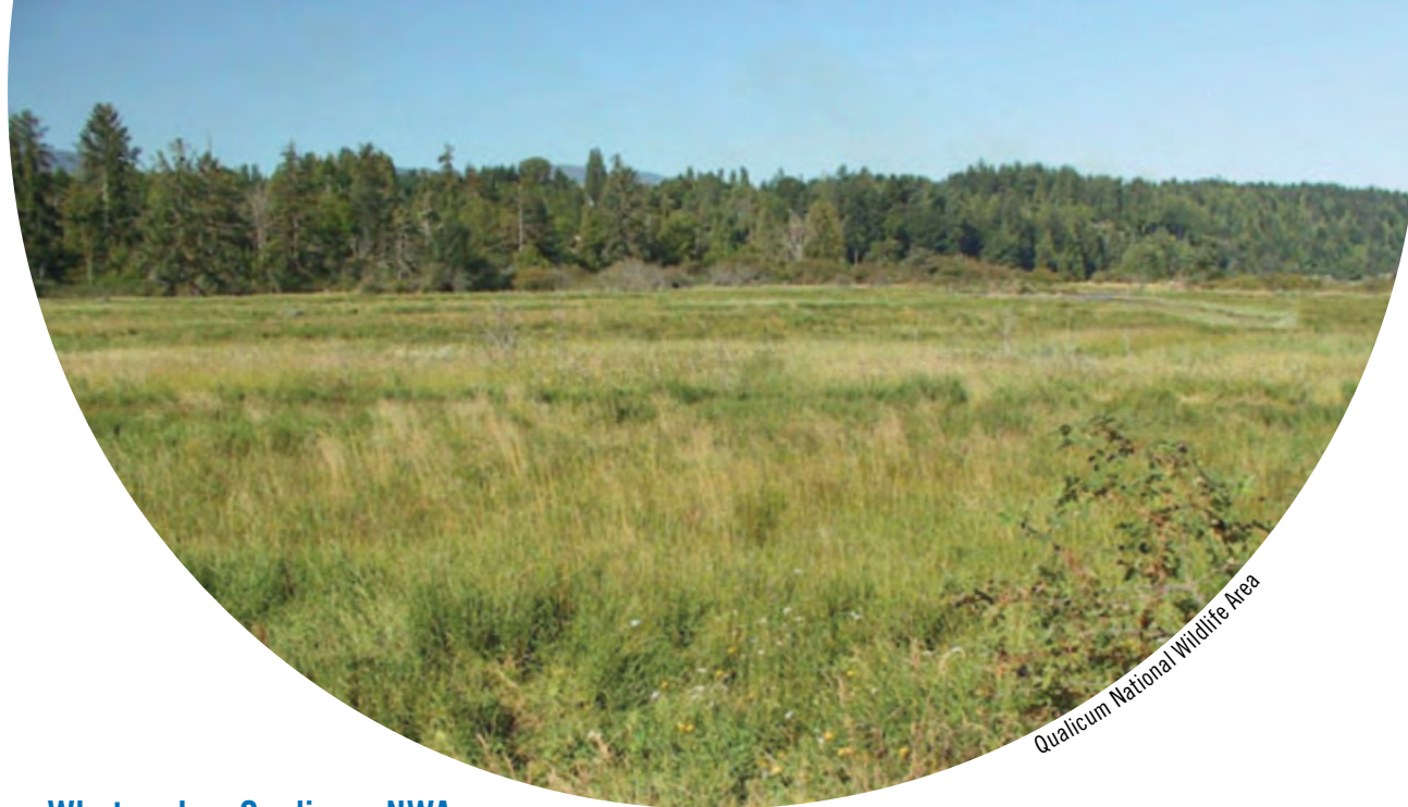
Qualicum National Wildlife Area