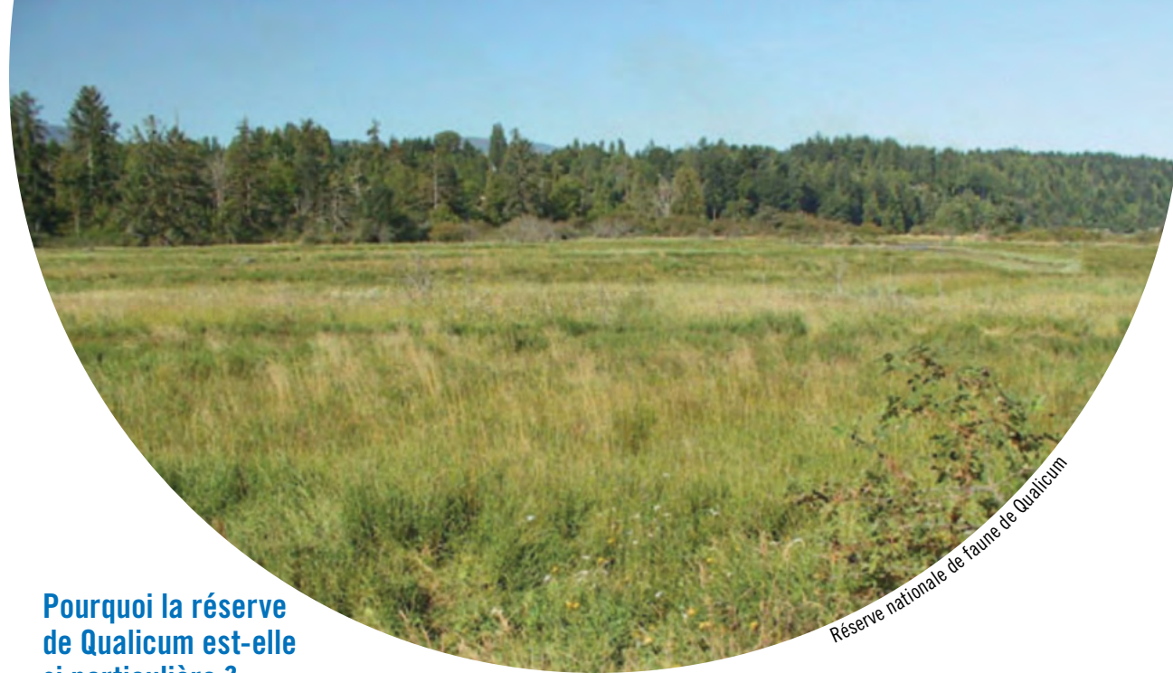
Réserve nationale de faune de Qualicum