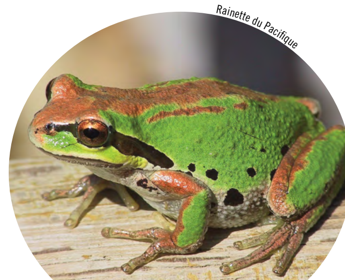
Rainette du Pacifique

L'accès à la RNF de Qualicum est permis. La chasse n'est pas permise dans les unités de Marshall-Stevenson et de Nanoose Bay, mais la chasse à la sauvagine est permise dans l'unité de Rosewall Creek (en vertu de règlements de chasse fédéraux et provinciaux). Pour certains types d'activité, des permis fédéraux ou provinciaux additionnels peuvent être requis. Pour de plus amples renseignements sur l'accès et les permis dans la RNF de Qualicum, veuillez communiquer avec le bureau régional d'Environnement Canada.