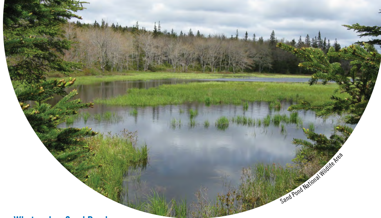
Sand Pond National Wildlife Area