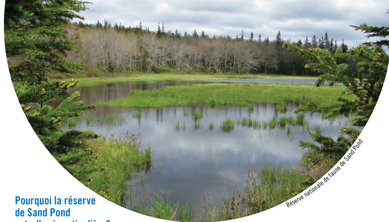
Réserve nationale de faune de Sand Pond