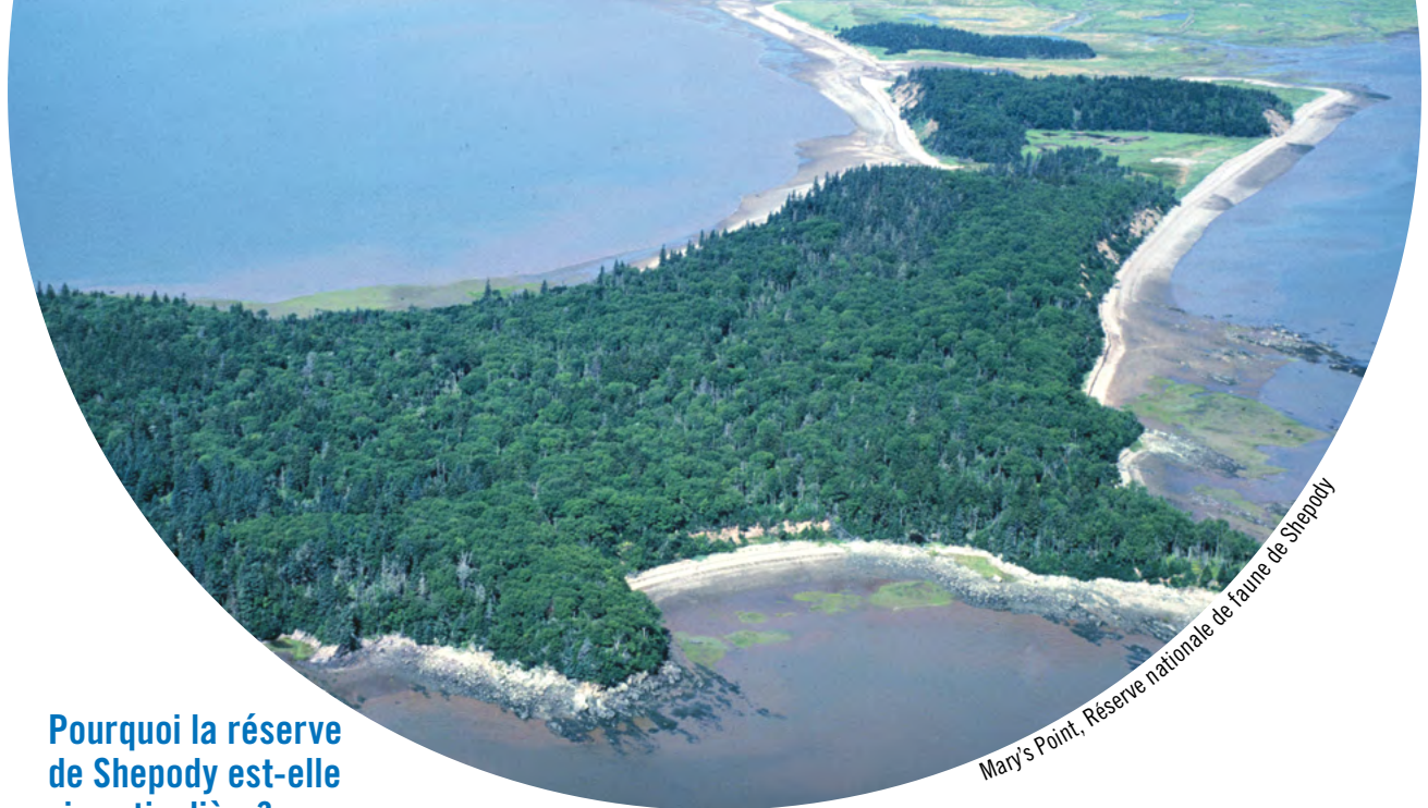
Mary's Point, Réserve nationale de faune de Shepody