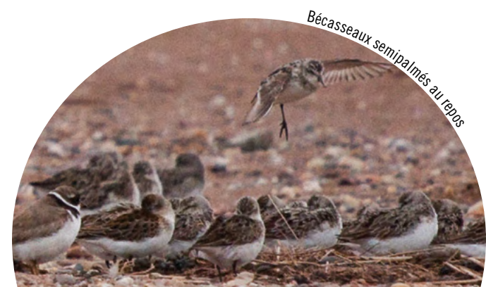
Bécasseaux semipalmés au repos

L'accès à la RNF de Shepody est permis pour certaines activités, notamment l'observation de la faune, la randonnée, la photographie et la cueillette de petits fruits. La chasse, le piégeage et la pêche peuvent également être pratiqués dans les parties de New Horton et de Germantown, mais sont assujetties aux règlements et conditions provinciaux et fédéraux. Environnement Canada gère un centre d'accueil d'interprétation autonome à Mary's Point, ouvert les jours de semaine en juillet et en août, alors que la migration des oiseaux de rivage est à son point culminant.