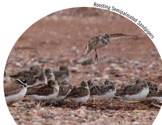
Roosting Semipalmated Sandpipers

Access to Shepody NWA is permitted for activities such as wildlife observation, hiking, photography and berry picking. Hunting, trapping and fishing are permitted at New Horton and Germantown in accordance with relevant federal and provincial regulations. Environment Canada maintains a self-interpreting visitors' centre at Mary's Point, which is open weekdays throughout July and August during the peak of shorebird migration.