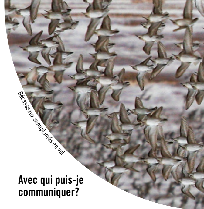
Bécasseaux semipalmés en vol