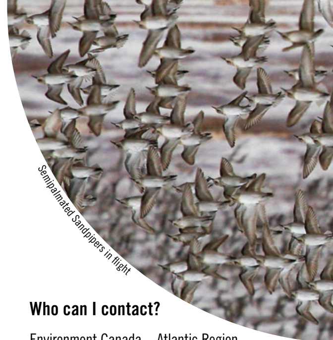
Semipalmated Sandpipers in flight