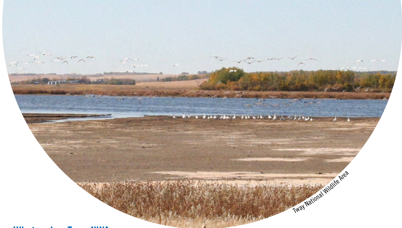
Tway National Wildlife Area