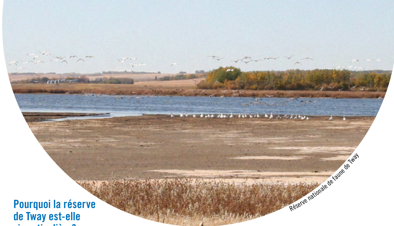
Réserve nationale de faune de Tway