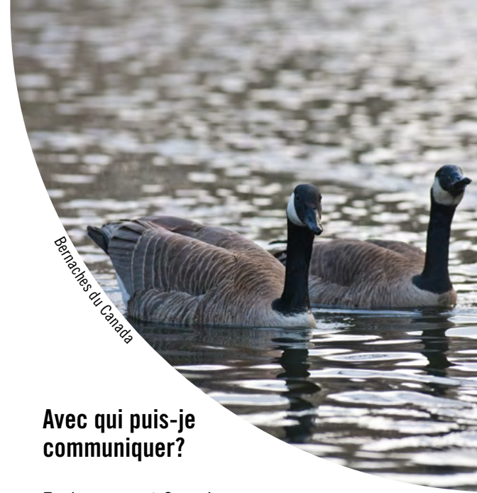
Bernaches du Canada