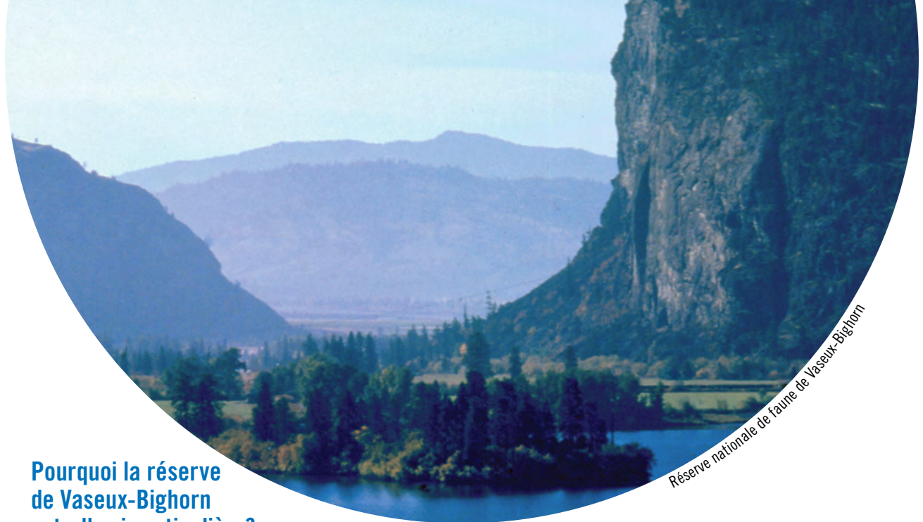
Réserve nationale de faune de Vaseux-Bighorn