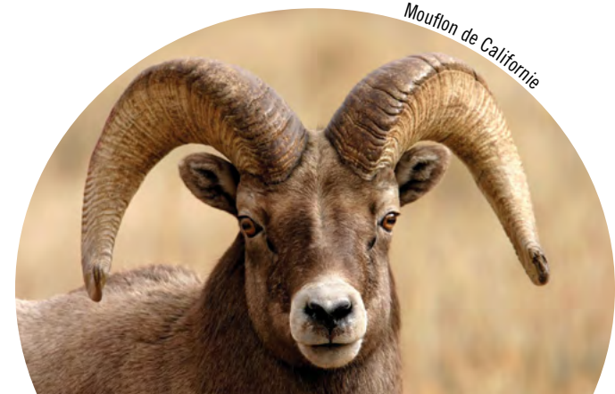
Mouflon de Californie

Le public est autorisé à accéder aux sentiers désignés, à la tour d'observation de la faune et à la promenade. Des oiseaux et d'autres espèces sauvages peuvent être observés à partir du sentier public et de la tour d'observation. L'accès à toutes les autres parties de la réserve est limité et toutes autres activités nécessitent un permis. Pour de plus amples renseignements sur l'accès et les permis, veuillez communiquer avec le Service canadien de la faune.