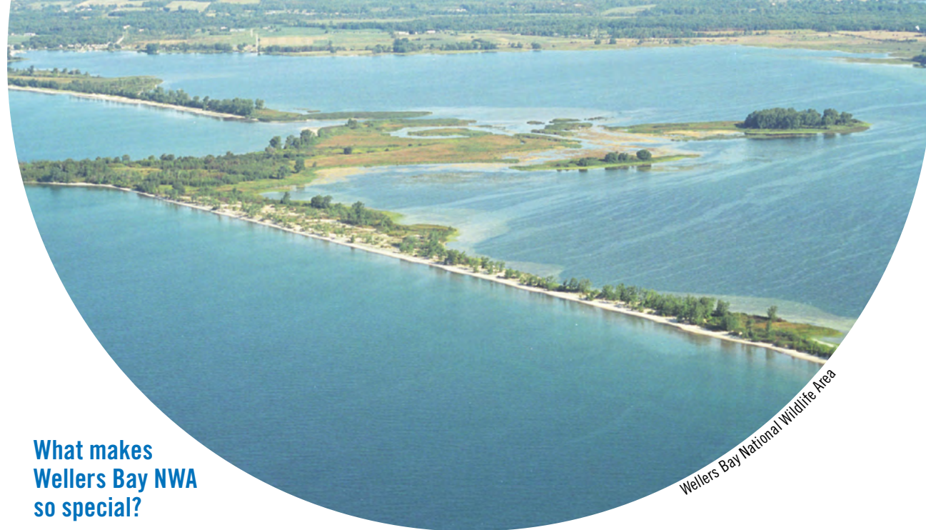
Wellers Bay National Wildlife Area