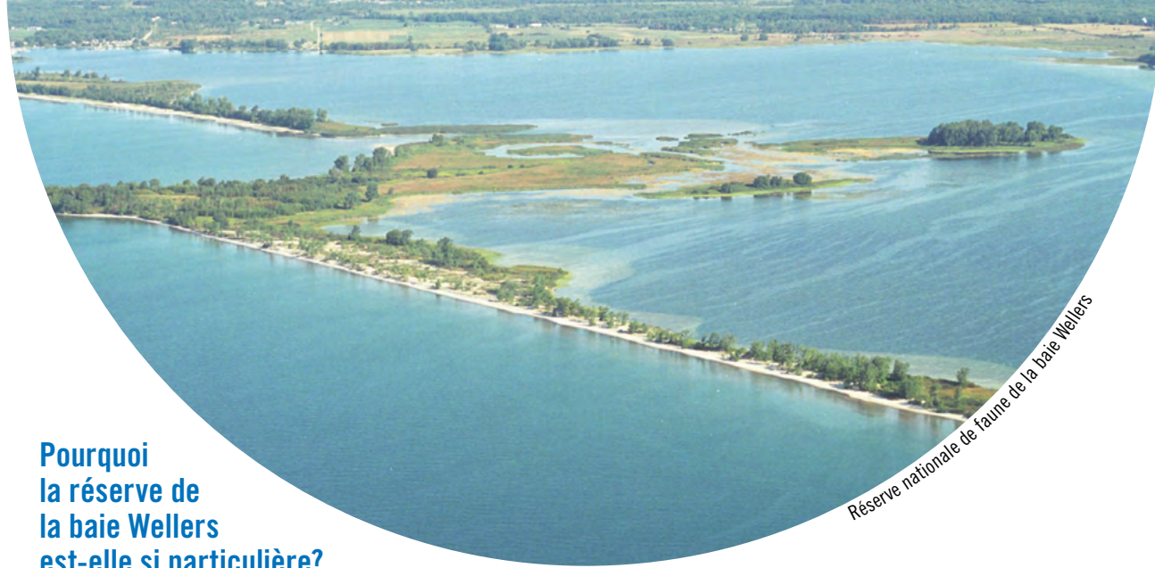
Réserve nationale de faune de la baie Wellers