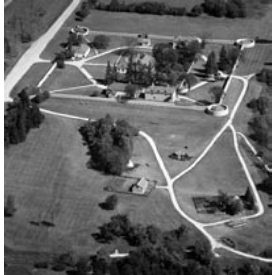
Lower Fort Garry

de signature des traités. Plus tard durant la même décennie, ils ont peut-être apporté du bois pour chauffer les baraques ou assisté aux offices religieux en compagnie des nouvelles recrues de la toute nouvelle Police à cheval du Nord-Ouest.