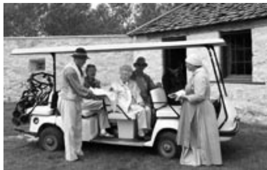
Voiturettes pour les visiteurs

Pour bien mettre à profit les capitaux investis dans ce réaménagement, on a créé sur place