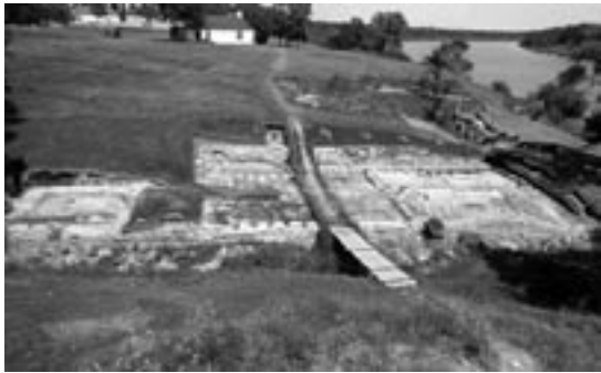
Fouilles archéologiques à Grist Mill