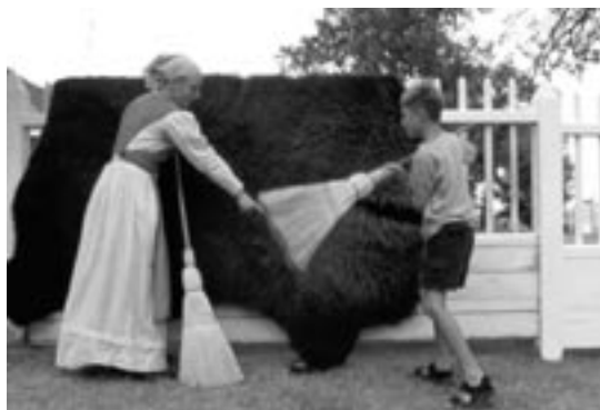
Visiteurs à Lower Fort Garry

Les mesures prises par Parcs Canada au cours des dernières années ont créé les conditions requises pour qu'on offre des expériences intéressantes et enrichissantes aux visiteurs de Lower Fort Garry. À beaucoup d'égards, le travail préparatoire a été effectué, les principaux investissements ont été faits et de nouvelles idées naissent et sont mises à l'essai. Tous ces efforts commencent à porter fruit. Plus important encore, ils favorisent l'établissement d'une culture axée sur l'innovation, la collaboration et un souci constant du service à la clientèle. Cependant, il est impératif de poursuivre sur notre lancée et de continuer d'assembler une combinaison de programmes, de services et d'installations permettant d'offrir aux visiteurs des expériences à la fois enrichissantes et intéressantes.