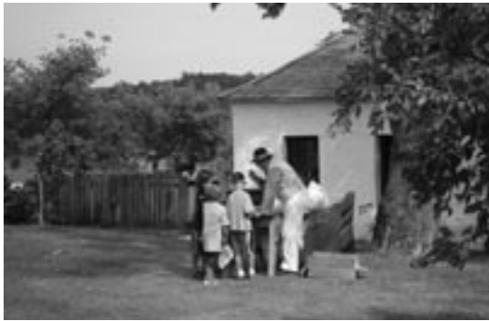
Bénévole de Parcs Canada en compagnie de visiteurs

Lower Fort Garry est l'un des meilleurs endroits de tout l'Ouest canadien pour découvrir l'un des épisodes déterminants de l'histoire du Canada, soit la traite des fourrures, tout comme l'échange des coutumes, des cultures, des croyances et des technologies entre les Européens et les premiers habitants du pays. Le fort était un centre de transbordement de première importance pour la Compagnie de la Baie d'Hudson à l'intérieur du réseau d'itinéraires de transport et de postes de traite qui s'étendaient à tout le continent.