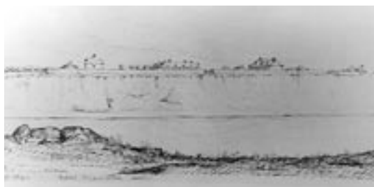
Esquisse par George F. Finlay de Lower Fort Garry 1847 Archives du Glenbow Museum

Lower Fort Garry devint un centre de transbordement et d'approvisionnement ainsi qu'un lieu de rassemblement pour les brigades régionales des pelleteries qui suivaient l'itinéraire rivière Rouge-Portage La Loche-York Factory. On trouvait à Lower Fort Garry des entrepôts où stocker les fourrures, les objets de commerce et les provisions ainsi que le pemmican et les produits agricoles essentiels aux équipages.