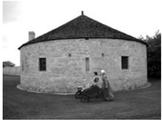
Le bastion sud-ouest