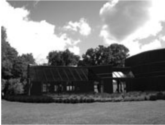
Panneaux solaires sur la terrasse du centre d'accueil

Ces dernières années, Parcs Canada a constaté qu'une grande partie de ses installations et équipements avaient presque atteint la fin de leur durée de vie. Or, le remplacement d'installations et d'équipements par d'autres qui utilisent les mêmes technologies n'est peut-être pas le meilleur usage qu'on puisse faire des ressources limitées dont on dispose. La réfection récente du centre d'accueil fait ressortir la nécessité d'orienter les investissements en fonction de l'atteinte de divers objectifs, afin d'assurer l'optimisation des fonds publics utilisés. Pour le projet du centre d'accueil, on a tenu compte des besoins et des attentes des visiteurs actuels et futurs, on a investi dans de nouvelles technologies d'économie d'énergie, de manière à réduire les coûts de fonctionnement, et on a intégré des éléments de conception propres à favoriser la création de plus de partenariats.