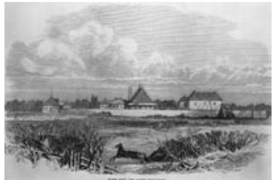
Fort de Pierre, colonie de la rivière Rouge

Une ressource culturelle est une œuvre humaine ou un endroit présentant des signes évidents d'activité humaine ou ayant une signification culturelle ou spirituelle, et dont