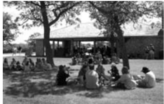
Pique-nique à Lower Fort Garry

les nouveaux programmes destinés à favoriser les visites assidues. Les enfants de la région proche constituent la plus grande partie des participants aux camps de jour pendant l'été et le congé du printemps.