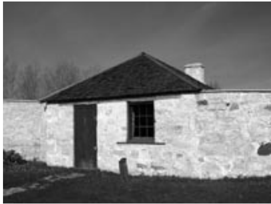
Le bastion nord-ouest et la boulangerie