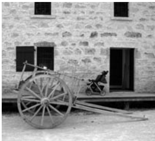
Charrette de la rivière Rouge

la valeur historique a été reconnue par une désignation ou par une croyance commune aux collectivités concernées en son importance historique, culturelle ou spirituelle. Les méthodes de gestion des ressources culturelles de Parcs Canada englobent :