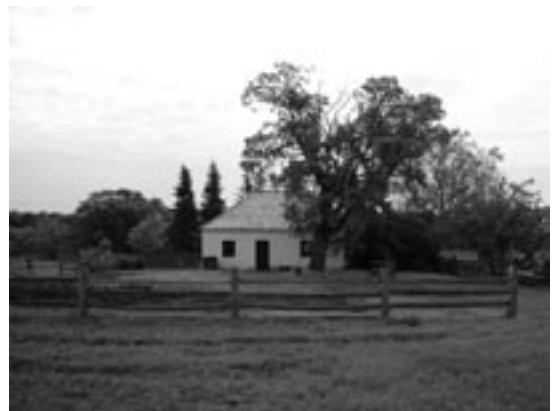
La maison des visiteurs (cottage Ross)