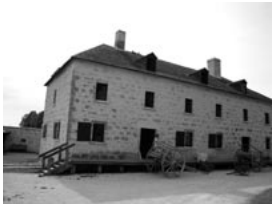
Le magasin et l'entrepôt des fourrures

L'entretien du large éventail de bâtiments et autres ouvrages qu'on trouve à Lower Fort Garry est assuré conformément aux normes et aux lignes directrices de conservation. Les bâtiments et ouvrages visés sont notamment les suivants :