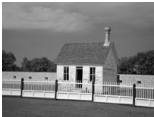
Le cabinet du médecin