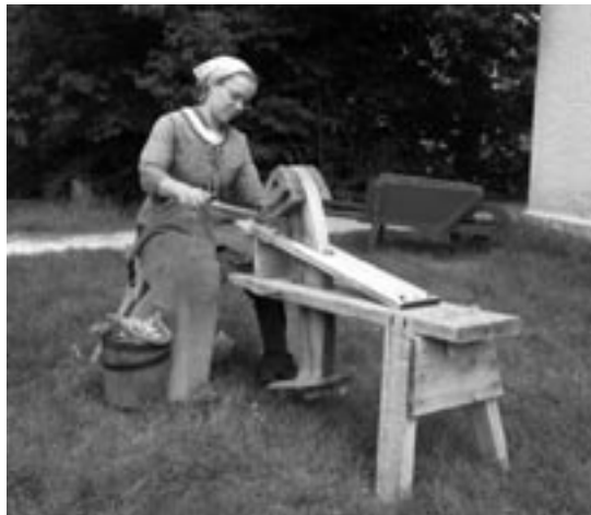
Démonstration de l'utilisation d'une plane de charbon

Le plan directeur définit un certain nombre d'objectifs stratégiques, d'objectifs particuliers et de mesures clés destinés à orienter Parcs Canada et ses partenaires pour rendre effective la vision souhaitée pour le lieu historique national du Canada de Lower Fort Garry. Les objectifs stratégiques correspondent au résultat général à obtenir. Les objectifs particuliers correspondent à des éléments plus restreints et mesurables, concernant la façon d'atteindre les objectifs stratégiques. Les mesures clés sont le point de départ de la mise en œuvre du plan et un moyen d'évaluer les progrès accomplis en ce qui a trait à la concrétisation de la vision définie pour le site dans les années à venir. De nouvelles mesures seront définies et mises en œuvre au fur et à mesure de l'évolution des questions en jeu.