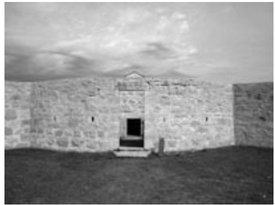
Le bastion nord-est et la poudrière