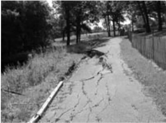
Rives affaissées du ruisseau Monkman

« Parcs Canada protège des exemples représentatifs du patrimoine naturel et culturel du Canada d'importance nationale de sorte que les citoyens et les citoyennes d'aujourd'hui et de demain puissent faire l'expérience des lieux exceptionnels et du riche répertoire d'histoires du passé de notre nation, et s'en inspirer. L'intégrité écologique et l'intégrité commémorative sont les principes directeurs de la gestion des parcs nationaux et des lieux historiques nationaux, de même que l'utilisation viable du milieu marin constitue la pierre d'assise de celle des aires marines nationales de conservation. Cela permet de veiller à ce que les trésors nationaux du Canada soient préservés pour les générations actuelles et futures. »