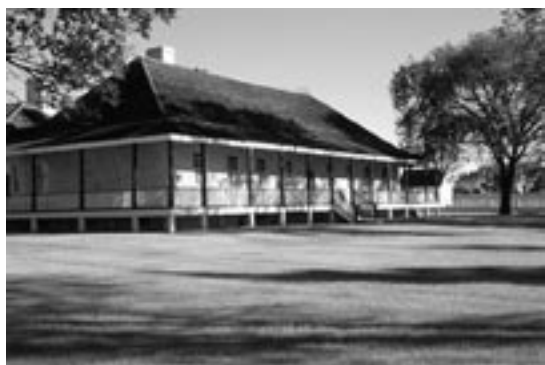
La Grande maison