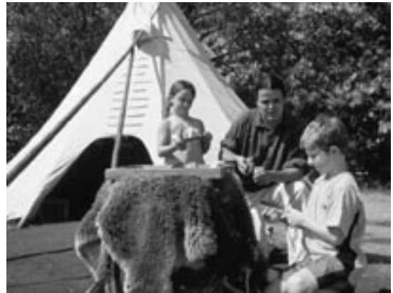
Interprète avec des enfants

Actuellement, la plupart des programmes sont offerts de mai à septembre. Quelques programmes peuvent être offerts pendant l'hiver sur demande. Les programmes continuent de faire une place importante à la période se situant au début des années 1850, quand Lower Fort Garry était le point de convergence de tout le milieu du commerce des fourrures dans la région du bas de la rivière Rouge. On a toutefois entrepris de diversifier le programme en adoptant une orientation plus souple et davantage axée sur le client.