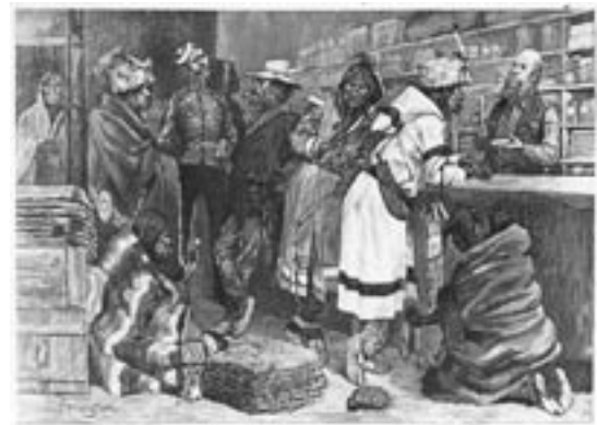
Interprétation d'un magasin de la CBH par Frederick Remington

À la suite de la cession du territoire de la Compagnie de la Baie d'Hudson à la nouvelle Couronne fédérale ainsi que pour faire face à l'expansion américaine vers l'ouest et aux actes criminels commis par les commerçants américains en sol canadien, le gouvernement du Dominion autorisa, en 1873, la création de la Police à cheval du Nord-Ouest. Trois contingents de cette police, formés à la hâte et dont les membres n'avaient encore reçu aucun entraînement, arrivèrent à Winnipeg à l'automne 1873. Ils passèrent l'hiver à Lower Fort Garry à s'entraîner et à apprendre les techniques policières requises. Au printemps 1874, les contingents prirent la route de l'ouest pour aller faire respecter le droit canadien dans les prairies.