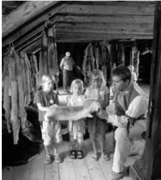
Interprète avec des enfants dans l'entrepôt des fourrures

Ils raconteront des récits vivants et fascinants, des récits qui ont l'ampleur et la profondeur du Canada lui-même. Les programmes seront soigneusement conçus pour intéresser les gens en s'adressant à leurs émotions et à leurs sens. Ainsi les visiteurs quitteront le site avec le sentiment clair et durable que ce lieu est bien plus qu'un vestige d'un passé lointain parce qu'ils s'y reconnaissent eux-mêmes encore aujourd'hui.