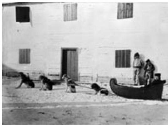
Un traîneau à chiens devant un poste de traite des fourrures

des rivières Rouge et Assiniboine et ils parvinrent, grâce à leurs pressions, à obtenir qu'on reconstruise un poste de la Compagnie près de leur lieu d'habitation.