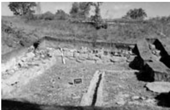
Mur de soutènement et égout faisant partie de la brasserie

Il y a aussi au nord des bastions et des murs plusieurs éléments archéologiques associés à la ferme. On y trouvait autrefois des jardins ainsi que des étables et des écuries. Le long du ruisseau Monkman, on peut observer les vestiges du complexe industriel et divers éléments associés aux activités de transport de marchandises et de navigation. Au sud du ruisseau Monkman se trouvent les vestiges de la maison du meunier et de campements