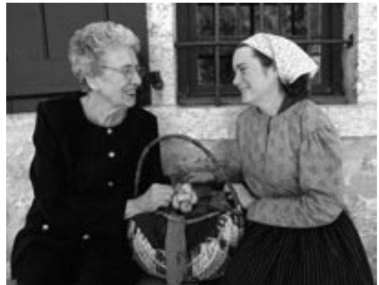
Visiteur avec une interprète

Plus tard, à l'époque de l'établissement des institutions gouvernementales dans la nouvelle province du Manitoba, Lower Fort Garry joua à nouveau un rôle de soutien, servant, à différents moments, de prison provisoire et d'asile pendant qu'on construisait les installations permanentes ailleurs. Beaucoup de bâtiments qu'on peut voir à Lower Fort Garry témoignent encore aujourd'hui de ces utilisations.