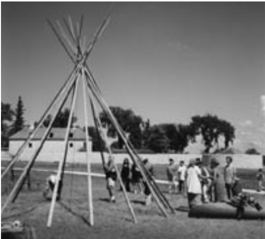
Installation d'un tipi

Parcs Canada établira un programme de mise en valeur du patrimoine composé d'activités d'apprentissage axées sur le divertissement, la culture et les faits. Les visites guidées, les animateurs costumés, les diverses activités et manifestations ainsi que les programmes exprimeront les échos et les perspectives authentiques des nombreuses cultures, sociétés et personnes qui composent la fascinante galerie de personnages associée à Lower Fort Garry et illustrent bien la diversité du Canada d'aujourd'hui.