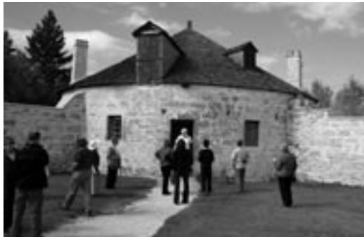
Visiteurs accompagnés d'interprètes

Les touristes. Les touristes qui viennent à Winnipeg et au Manitoba passent quelques heures au lieu historique national du Canada de Lower Fort Garry durant leur visite de la région. Ils se déplacent en véhicule privé virgule et enlever le "et" ils ont entendu parler du site en consultant des sources d'information touristique, en naviguant sur Internet ou par des gens ou des services de la région. Le plus souvent, ils effectuent leur visite pendant l'été, quand les programmes sont offerts dans leur intégralité. Les touristes peuvent aussi faire partie de groupes organisés, qui participent à un programme d'activités planifié. Des éléments laissent présager qu'on assistera à une croissance des voyages organisés centrés sur des thèmes patrimoniaux, qui pourraient établir un lien entre Lower Fort Garry et d'autres sites et attractions.