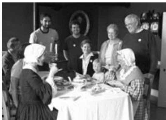
Visiteurs à la Grande maison

Le lieu historique national du Canada de Lower Fort Garry fait partie d'un réseau d'aires patrimoniales protégées de Parcs Canada comprenant des parcs nationaux, des aires marines nationales de conservation et des lieux historiques nationaux. Plus de 890 lieux historiques désignés par le gouvernement fédéral partout au pays commémorent des millénaires d'histoire humaine en en faisant ressortir une grande diversité de perspectives; embrassant la vie politique, économique, intellectuelle, culturelle et sociale au pays. Chaque lieu a eu une incidence nationale notable sur l'histoire du Canada ou illustre un aspect important de cette histoire. Parcs Canada exploite 154 de ces lieux; les autres sont exploités par d'autres ministères, par des provinces et territoires, par des municipalités ou par des propriétaires privés.