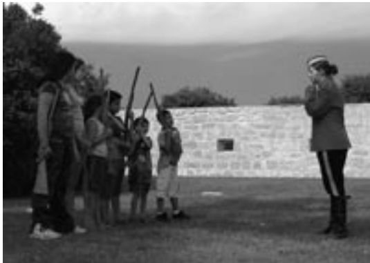
Des visiteurs apprennent les exercices d'entraînement de la Police à cheval du Nord-Ouest.

L'objectif de commémoration est la raison précise pour laquelle un lieu est désigné comme étant d'importance nationale. L'objectif de commémoration découle des recommandations de la Commission des lieux et monuments historiques du Canada (CLMHC), lesquelles sont approuvées par la ministre responsable de Parcs Canada.