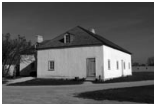
La maison des hommes