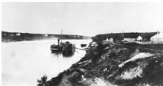
Le bateau à vapeur Colville rangé le long de l'entrepôt flottant à Lower Fort Garry 1879

En 1871, la Couronne fédérale, voulant faire en sorte que l'ouest puisse être colonisé, était à la recherche d'un lieu assez grand et des ressources nécessaires pour entreprendre des négociations avec les Premières nations. Lower Fort Garry devint ainsi l'endroit où eurent lieu les négociations entre les Sauteaux (Ojibways) et les Moskégons, d'une part, et la Couronne, d'autre part, et où fut signé le traité numéro un, qui a servi de modèle pour tous les traités numérotés ultérieurement.