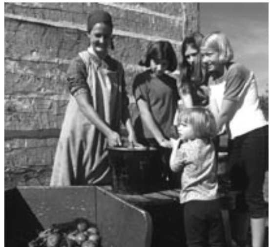
Participants à la Journée des enfants

En 2005, les conditions de conservation de la collection archéologique de Lower Fort Garry ont été améliorées pour qu'elles satisfassent aux normes actuelles. Par ailleurs, on a constitué un échantillon d'objets devant faire l'objet d'une plus grande attention parce que faisant partie de la collection de référence de Lower Fort Garry. Cette mesure visait à s'assurer que les ressources en question sont protégées et accessibles pour la mise en valeur du patrimoine.