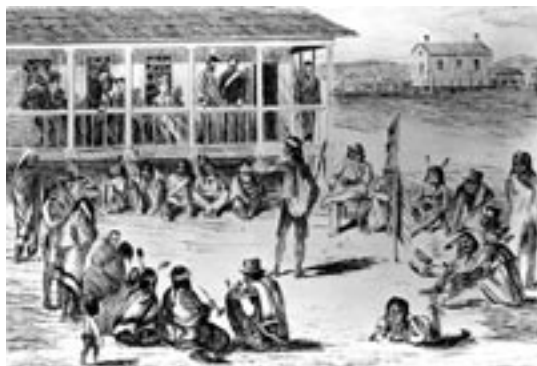
Illustration des négociations du traité numéro un à Lower Fort Garry Archives du Glenbow Museum

Lower Fort Garry était un centre de transbordement et d'approvisionnement ainsi qu'un lieu de rassemblement pour les brigades régionales des pelleteries qui suivaient l'itinéraire de la rivière Rouge-Portage La Loche-York Factory. On trouvait à Lower Fort Garry les entrepôts où stocker les fourrures provenant de la région ainsi que le pemmican et les produits agricoles nécessaires pour assurer la poursuite du commerce.