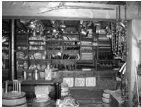
Objets historiques dans le magasin

autochtones de l'époque préeuropéenne. Selon les documents historiques, il resterait encore à mettre au jour au moins 83 ouvrages ou aires d'activité non examinées, ce qui montre l'importance d'intégrer les fouilles archéologiques aux projets de mise en valeur du lieu.