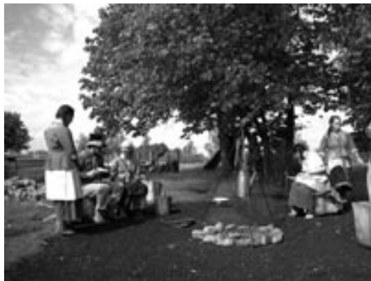
Le campement des Autochtones

De plus, en raison de son affluence et de sa proximité du marché de Winnipeg, Lower Fort Garry peut se révéler utile de différentes