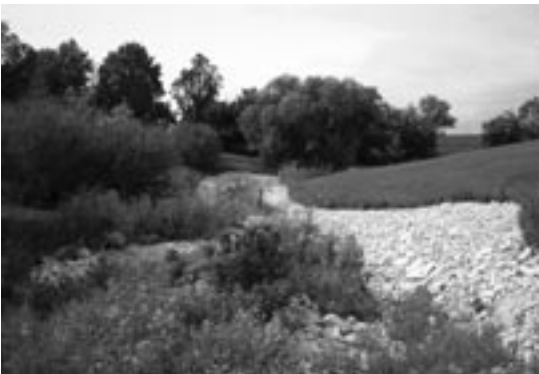
Ruisseau Monkman après les travaux de stabilisation des rives