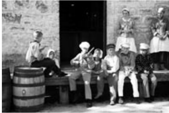
Participants à la Journée des enfants