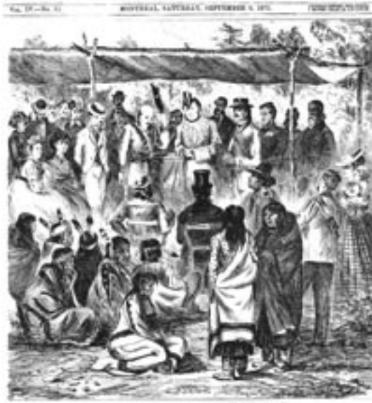
Illustration des négociations pour le traité numéro un Harper's Weekly Archives du Glenbow Museum

Assiniboine remplacèrent les convois de charrettes qui effectuaient les voyages à partir du sud. Dans les années 1880, avec l'arrivée du Chemin de fer Canadien Pacifique à proximité d'Upper Fort Garry, les itinéraires de bateaux à vapeur devinrent inutiles.