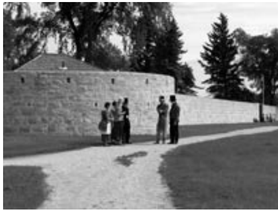
Le bastion sud-est