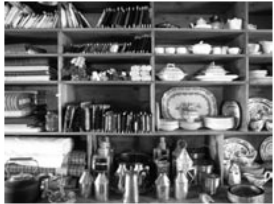
Objets historiques dans le magasin