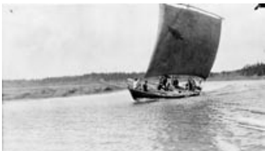
Bateau York à voile

En 1826, à la suite d'une grave inondation, le gouverneur du district, George Simpson, ordonna la construction d'un nouveau fort sur un terrain plus élevé situé plus au nord, en aval des rapides St. Andrews. On entreprit la construction du nouveau fort en 1831, en utilisant du calcaire extrait des carrières locales. En 1838, la construction de la « Grande maison », d'un magasin et d'un entrepôt était terminée. Cependant, la plupart des colons de la rivière Rouge et des Assiniboins qui commerçaient ordinairement avec la Compagnie de la Baie d'Hudson continuèrent d'habiter près de la « fourche »