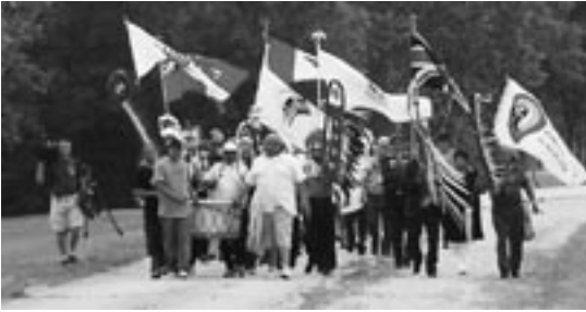
Défilé solennel à la réunion de la Commission des traités du Manitoba