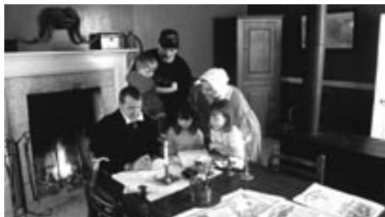
Intérieur de la Grande maison

Le programme d'animation costumée étoffé offert à Lower Fort Garry par du personnel saisonnier, des étudiants occupant un emploi d'été et des bénévoles est d'excellente qualité et est vivement apprécié par les visiteurs, comme en témoignent les résultats du sondage mené par Parcs Canada sur le degré de satisfaction de ces derniers en 2005. Il ressort toutefois du même sondage que beaucoup de visiteurs ne retiennent rien des messages de mise en valeur du patrimoine.