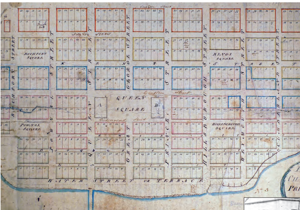
Plan de « Charlotte Town » par John Plaw, 1817 (Archives publiques de l'Île-du-Prince-Édouard, carte 0887). En anglais seulement.

Dans les années précédant la construction de l'édifice colonial, Charlottetown est une ville très différente. Sur ce plan de la ville de Charlottetown datant de 1817, vous pouvez constater l'aire connue comme le carré Queens réservée aux édifices gouvernementaux, aux églises et à un marché.