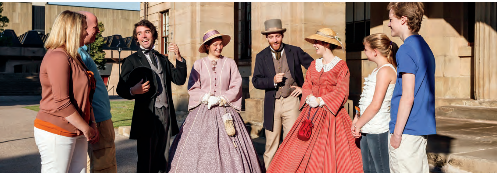
Province House (Stephen DesRoches)