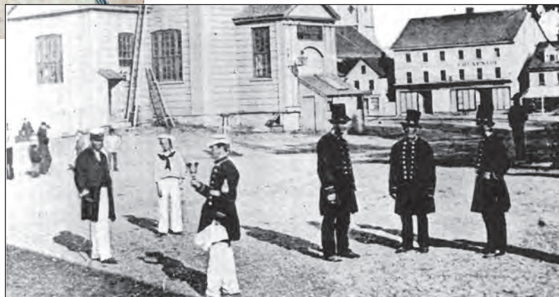
Le palais de justice conçu par John Plaw, qui a abrité l'Assemblée législative de l'Île-du-Prince-Édouard de 1812 à 1847 (Cullen 1977, 237).

Avant la construction de l'édifice colonial, les membres de l'Assemblée législative de l'Île-du-Prince-Édouard se réunissent d'abord dans des maisons privées et des tavernes et plus tard, au palais de justice conçu par John Plaw. En 1837, le lieutenant-gouverneur sir John Harvey fait comprendre à l'Assemblée législative que la colonie doit avoir un nouveau bâtiment servant à conserver en lieu sûr les documents publics. Tous sont d'accord et 5 000 livres sont versées pour la construction d'un édifice où loger les deux chambres de la législature et les bureaux de la colonie. Il faudra un autre montant d'au moins 5 000 livres pour terminer l'édifice en ajoutant des locaux pour la Cour suprême.