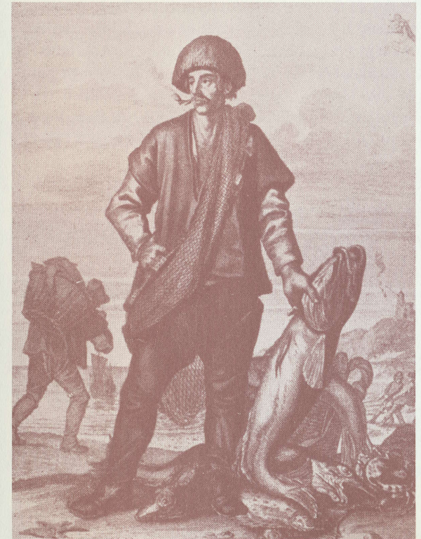
Un pêcheur du 18e siècle