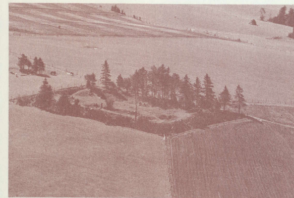
FORT AMHERST - au début du 20ème siècle. early 20th century.

Les malheurs qui frappèrent la colonie ne résultaient cependant pas tous des caprices de la nature. A l'été de 1745, une troupe venue de la Nouvelle-Angleterre, encore animée par la victoire qu'elle venait de remporter à Louisbourg, descendit sur Port LaJoye. La garnison de vingt hommes riposta à l'attaque mais fut incapable de résister longtemps, et le contrôle de l'île fut concédé aux Britanniques jusqu'en 1748. Pendant toute la durée de l'administration britannique, de 1745-48, le sort des habitants demeura incertain. Les établissements de Port LaJoye et de Trois-Rivières avaient été incendiés par les envahisseurs et des rumeurs circulaient à l'effet que tous les habitants seraient expulsés de l'île. Quelques-uns prirent peur et s'enfuirent, tandis que d'autres, y compris les familles qui restaient à Port LaJoye, s'enfoncèrent à l'intérieur des terres où ils seraient plus à l'abri du danger.