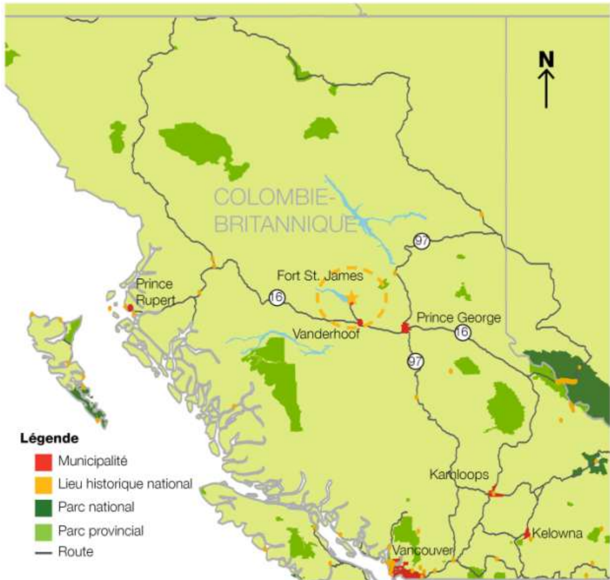
Figure 1. Cadre régional du lieu historique national du Fort-St. James

Le lieu historique national du Fort-St. James est situé dans le Centre-Nord de la Colombie-Britannique (voir la figure 1), sur la rive sud du lac Stuart, entre la réserve des Nak'azdlis et le centre de la localité de Fort St. James (voir la figure 2).