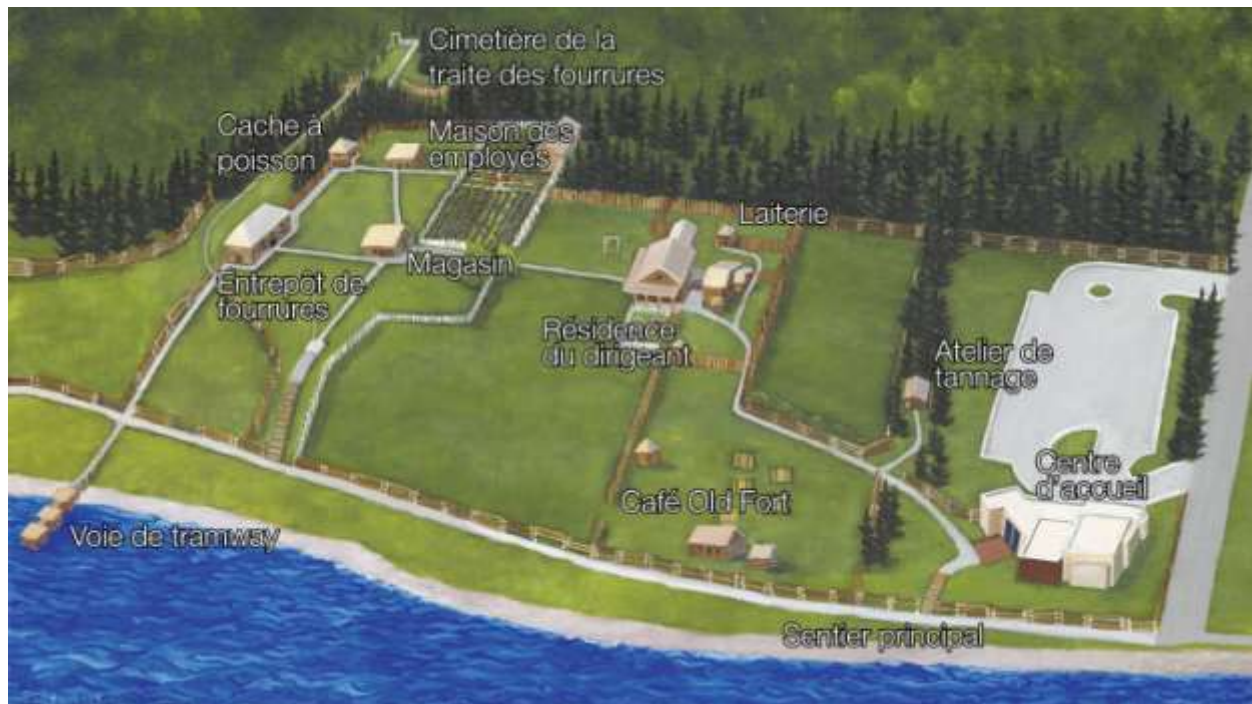
Figure 3. Lieu historique national du Fort-St. James

Parcs Canada confie à des services de sécurité la tâche de patrouiller dans le lieu historique, et il participe à des programmes communautaires visant à réduire le vandalisme et la criminalité.