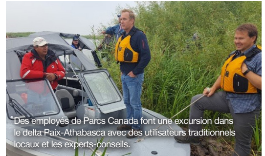
Des employés de Parcs Canada font une excursion dans le delta Paix-Athabasca avec des utilisateurs traditionnels locaux et les experts-conseils.

L'EES se veut une évaluation indépendante des activités et des tendances qui pourraient menacer la santé ou l'intégrité des valeurs universelles exceptionnelles du parc. Bien d'autres études traitent des impacts possibles sur le parc, mais