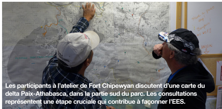
Les participants à l'atelier de Fort Chipewyan discutent d'une carte du delta Paix-Athabasca, dans la partie sud du parc. Les consultations représentent une étape cruciale qui contribue à façonner l'EES.

Le cabinet IEC a rédigé un addenda à l'ébauche du rapport d'orientation qui met en relief les orientations clés adoptées à la lumière des résultats de l'examen. Le présent bulletin résume les principaux commentaires