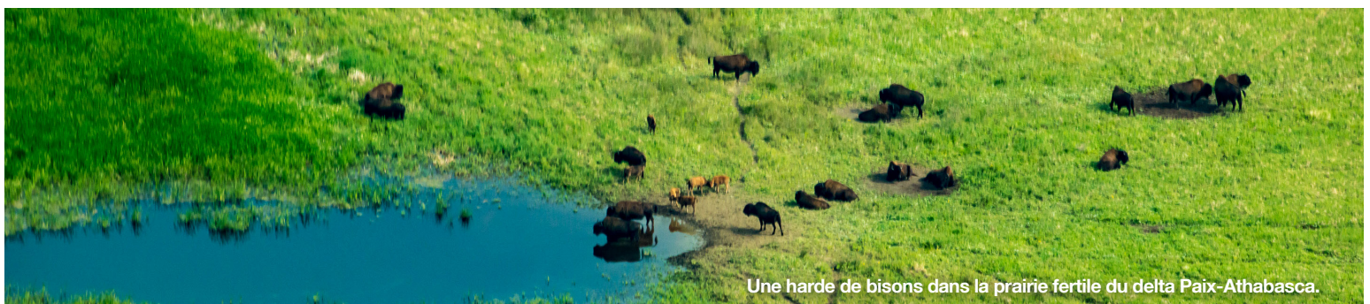
Une harde de bisons dans la prairie fertile du delta Paix-Athabasca.

groupes autochtones et des intervenants. Le plan d'action, qui contiendra aussi une description des initiatives lancées par différentes administrations en réponse aux recommandations de la mission de suivi réactif, doit être remis le 1 er décembre 2018. La mise en œuvre des activités décrites dans le plan se fera en continu.