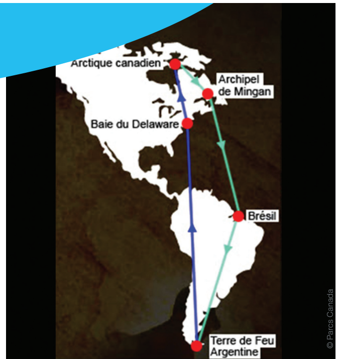
Trajet migratoire du bécasseau maubèche rufa