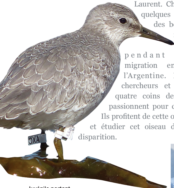
Juvenile portant un drapeau d'identification et un géolocalisateur

Ils profitent de cette occasion pour observer et étudier cet oiseau de rivage en voie de disparition.