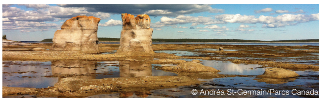
L'archipel de Mingan, une aire protégée importante pour les limicoles

Les chercheurs guettent l'apparition de ces drapeaux sur leur territoire et communiquent leurs observations. Ils attendent tous le plus vieux : un mâle âgé d'au moins vingt ans portant le drapeau B95 ! Surnommé « Moonbird », il est devenu une vedette médiatique avec le temps. À Mingan, il a été aperçu la dernière fois en août 2013. En janvier 2014, il a encore été observé mais cette fois, à Rio de Grande en Argentine.