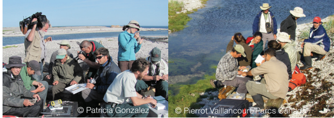
Chercheurs internationaux à la réserve de parc national de l'Archipel-de-Mingan