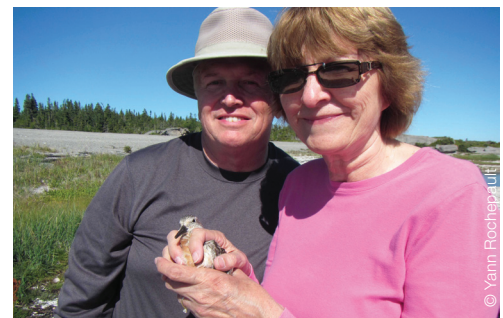
Inspiré par l'histoire de B95 du livre Moonbird , ce couple de Chicago est venu à Mingan pour participer à une capture de bécasseaux

De plus, Parcs Canada a conçu du matériel pédagogique permettant aux enseignants de renseigner leurs élèves sur cet oiseau et son écologie. Ils espèrent ainsi inspirer la prochaine génération de scientifiques, de bénévoles et de visiteurs de l'archipel de Mingan.