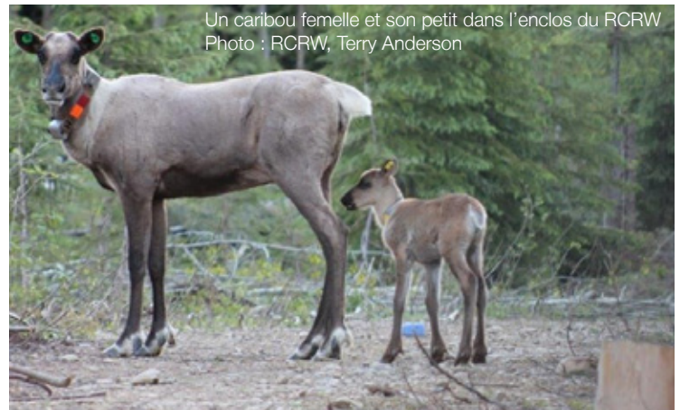
Un caribou femelle et son petit dans l'enclos du RCRW

Parcs Canada appuie l'initiative de la RCRW Society en contribuant financièrement au projet et en y affectant des employés et du matériel. L'agence a attribué à l'organisme 19 000 $ la première année (2013) et 40 000 $ la deuxième année (2014), pour contribuer aux coûts de lancement du projet, auquel elle a aussi affecté employés et matériel. L'Agence Parcs Canada s'est engagée à apporter en tout temps son soutien et sa collaboration à cette importante initiative. Par ailleurs, la RCRW Society a reçu récemment du financement d'Environnement Canada pour l'amélioration de la survie des caribous naissants grâce à la mise bas en enclos dans la harde de la chaîne Columbia, en Colombie-Britannique. Ce financement garantit la poursuite du projet jusqu'à la fin de 2015.