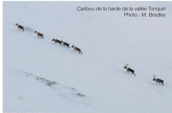
Caribou de la harde de la vallée Tonquin

Dans le cadre du Programme de rétablissement de la population des montagnes du Sud du caribou des bois ( Rangifer tarandus caribou ) au Canada, mis en œuvre en juin 2014, Parcs Canada a l'obligation juridique d'empêcher la destruction des habitats essentiels du caribou. Dans les parcs nationaux des montagnes, des mesures importantes de protection d'habitats essentiels sont déjà en place.